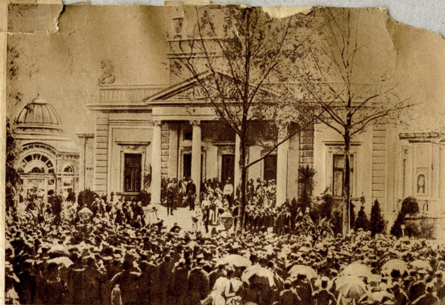
Megnyitási ünnepély. Alsó kép: a záróünnepély. (Egykorú fényképek.)