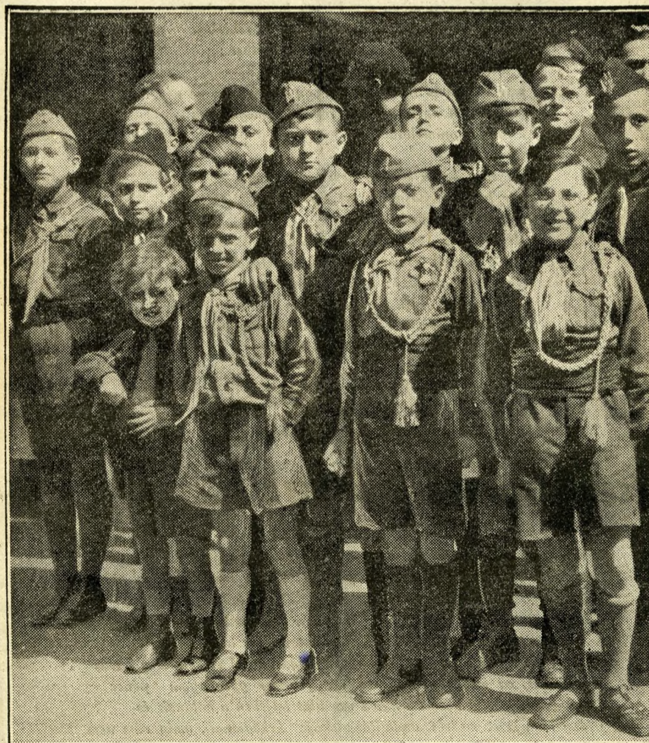
Balillák a Fascio bejárata előtt