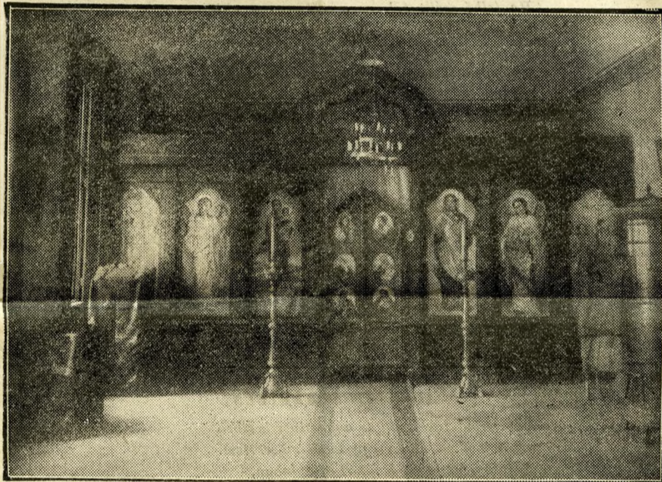
A rózsá-utcai orosz templom

akik Párisban, Berlinben egész városnegyedeket népesítenek be, akiknek az említett városokban külön színházak, kabarék, nyomdák, ujságjaik, szállók, vendéglők és — zalogházak vannak, itt mindössze 5—600 lelket számlálnak. Azok is elszórtan élnek, benn a városban, Szentlőrincen, Újpesten, a Mária Valéria-telepen, Zita-telepen, palotában, albérletben, barakkokban. Tudvalevően igen sokan vannak közöttük, akik a cári Oroszországban rendkívül magas állásokat töltöttek be s akik most kőműves, napszámos, gyári munkával keresik kenyerüket. Az is ismeretes, hogy különböző politikai pártokba tömörülnek s az egyes pártok közti ellentét meglehetősen éles. Ennek az az oka, mint pópájuk mondja, hogy ezek a szerencsétlen száműzöttek szomorúak, elkeseredettek, tehát idegesek és ingerlékenyek; azért torzalkodnak annyit. Van egy iskolájuk a Sziv-utcaiban, ugyanott van a templomuk is, ahol