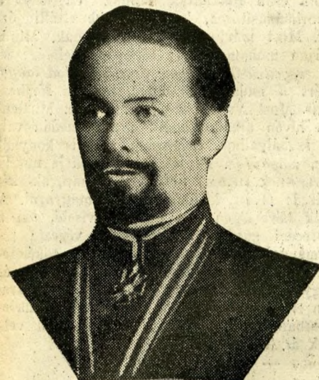
Az oroszok papja