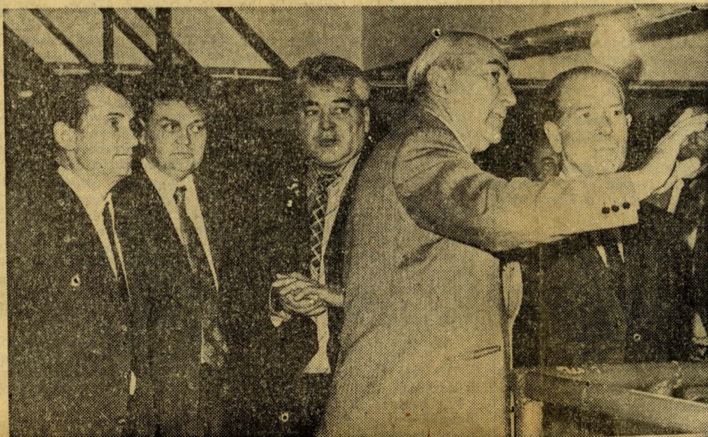
Vendégeink a gyár víztisztító üzemében hallgatják a tájékoztatót.