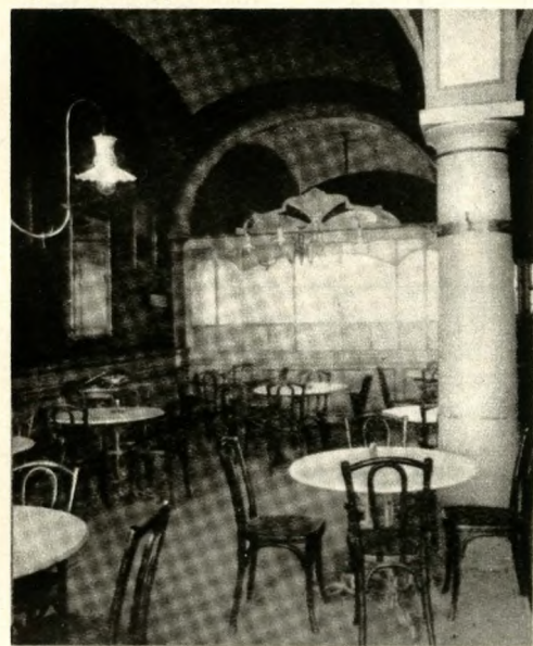
A Pilvax részlete 1911-ben. Az oszloptól balra volt a „Közvélemény asztala”

Ide járt Pálffy Albert regényíró, Várady Antal író, Kerényi Frigyes, Tompa Mihály, Vajda János költők, Bérczy Károly, Puskin fordítója, Obernyik Károly drámaíró, Pákh Albert novellista és az egész jóérzésű ifjú nemzedék. Becsülték a beérkezett híres költőket, különösen Vörösmartyt, de tudták, hogy a Nemzeti Kör tagjai nagyjából „nem eléggé proletáriátusok ahhoz, hogy kávéházba füstölögjenek” — mondta Jókai. Friss ritmust diktáltak a fiatalok és előretörésük először