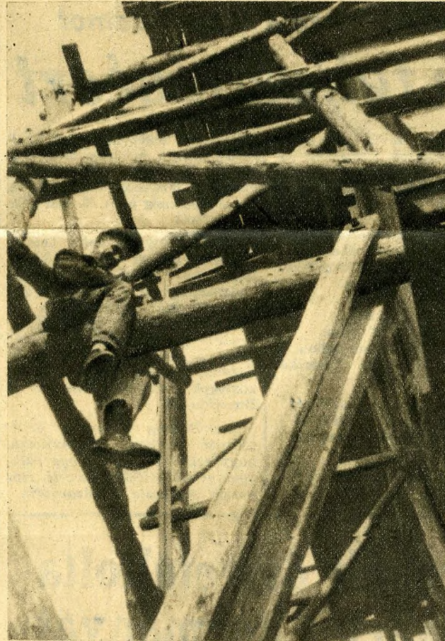
Ég és víz között lebeg Lindenberger Gyula ács-élmunkás. Életveszély, baleset, oda se neki, »a maga arcára dolgozik« — mondja és az arcán mosoly virul