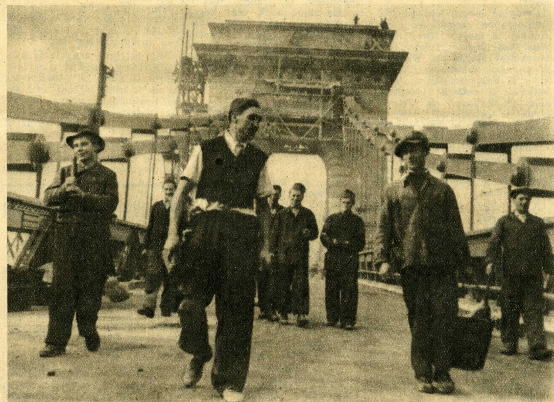
Leteszik a csákányt, kalapáccot, vége a mai munkának. Saját klubjukba sietnek a Lánchíd építői megnézni a hídepítésről készült filmet

Bolero — Faust-ballett — Mosoly országa — Tézene