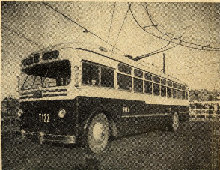
Trolibusz — Budapest kedvence

Az egész országot átfogó hatalmas munkalendület itt lüktet legerősebben. A város korán ébred. Hajnali 4 órakor egymásután futnak ki a kocsisínből az autóbuszok, villa-