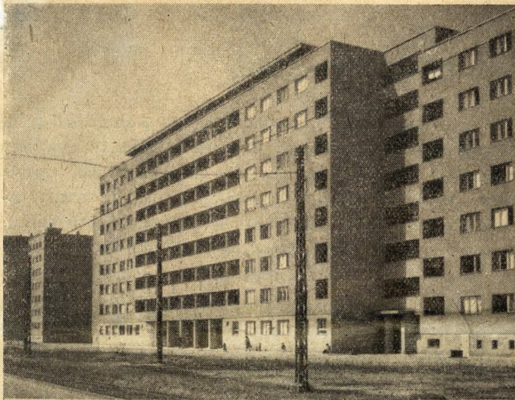
Béke-úti él munkásházak

áruház ne nyitná meg kapuit. Ezen túlmenően Budapest tanácsai a helyiipari vállalatokat is nagy mértékben fejlesztik. Az egyes kerületi tanácsoknak saját vállalataik vannak, melyek feladata a lakosság mindennapi szükségleteinek a lehetőség szerint maradéktalan kielégítése. Az egyes kerületi tanácsok mértékutáni szabóvállalatai a legjobb minőségű ruhákkal látják el a város lakosságát. Különös gondot fordítanak a tanácsok a javítóvállalatok és szövetkezetek munkájára. Ezzel is a háziasszonyok munkáján könnyítenek.