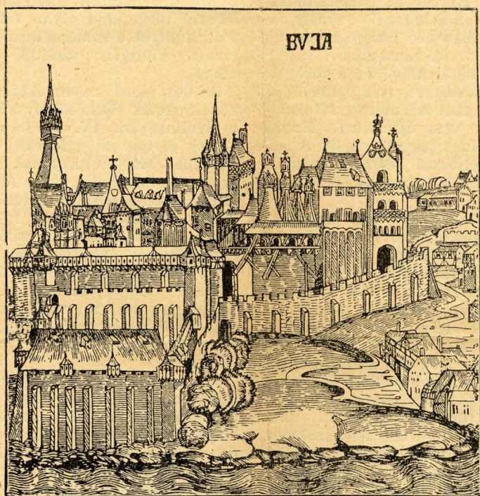
A budavári királyi palota Mátyás korában, amelynek pazar fényéről mesés leírásokat közöltek a nagy király korabeli történetírók. (Schedel világkrónikájából.)

lantásra barokkstilusúnak látszik. Ám a francia eredetű, a kellemes, hajlott vonalakat kedvelő barokk építési ízlés hozzánk csak a törökök kiűzése után jó félszázaddal, a tizennyolcadik század elején került el bécsi közvetítéssel. Valóban erre