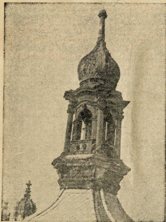
Kossuth Lajos utca 2.

Budapesten éppúgy, mint más világvárosok rengetegeiben kőművesek, bádigosok, tetőfedő munkások, állványozók és szerelők százai és százai naponta házak, gyárkémények, tornyok és kupolák szédítő magasságában, áttérnyerdők lélekvesztő labirintusaiban keresik kenyerüket. Ezek az emberek nem a „város peremén”, hanem a „város tetején”, házak, kémények, tornyok meredélyein fejük felett gyakran 50—100 méter magasságban lebegve végzik mindennapi munkájukat: tetőt fednek, gyárkéményt emelnek, lefolyót javítanak, paloták, templomok kupoláit vagy tornyait szerelik, javítgatják. Épülő lakótelepeink, fiatalodó körutaink, új középületeink szakadatlan munkára szólítják őket. Munkájuk nyomán szebb, csinosabb lesz a város. Tegyük most mi is egy körsétát a város tetején, tekintsük meg Budapest néhány nemrég helyrehozott tornyát.