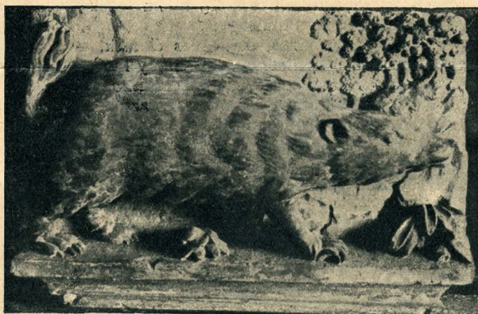
Beszélő kövek. Kőből faragott borz. A Borz-utca egyik házáról