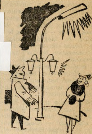
(Tóncz Tibor rajza)

ten. Es egy újabb forradalom következik ezután: a villany! A villany történetét már nem