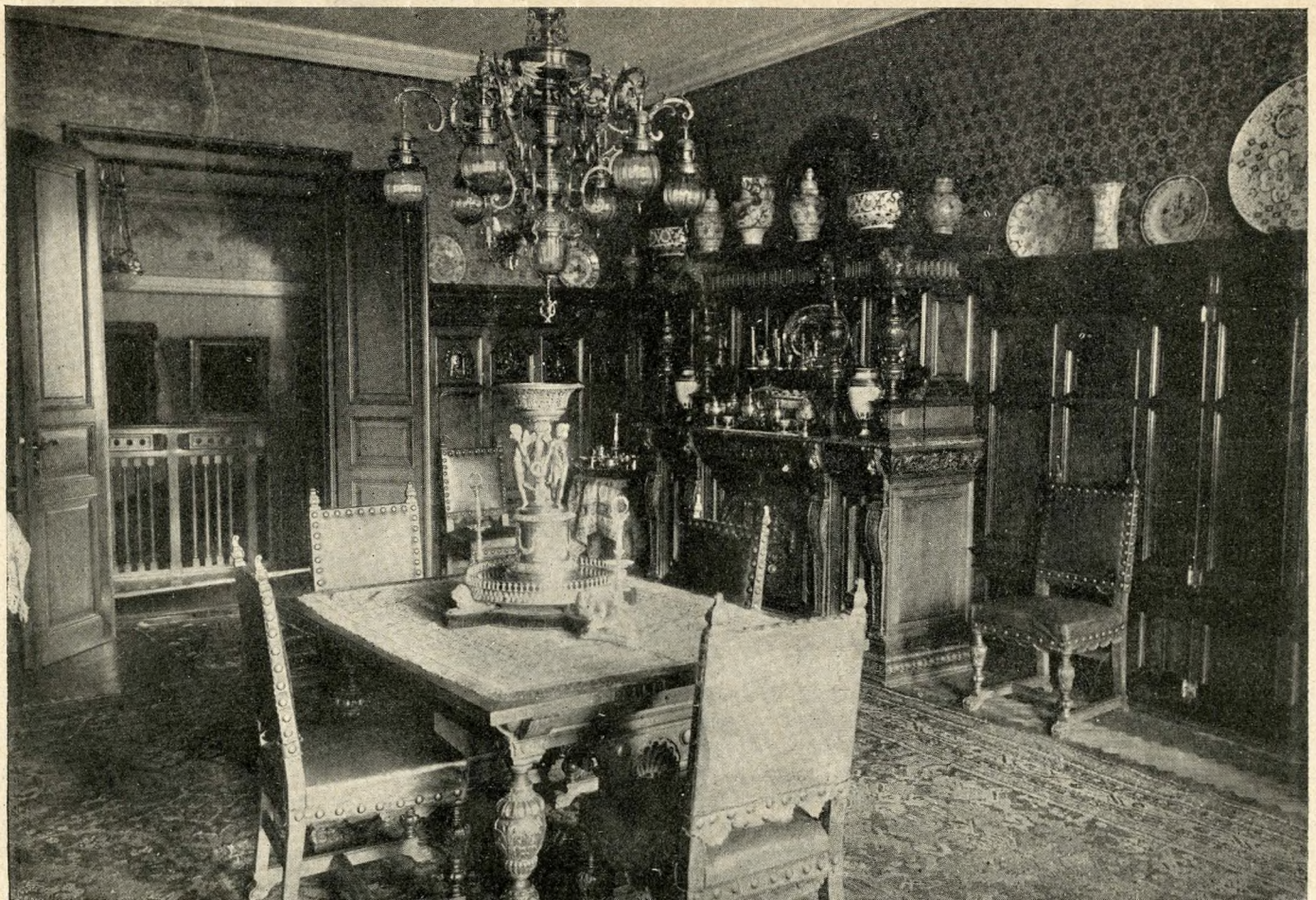
A RÁTH GYÖRGY-MÚZEUM