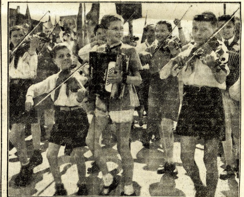
Részlet az úttörők felvonulásából