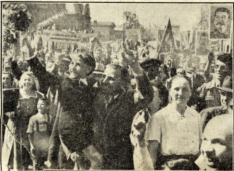
Fiatalkorú és idősebbek szeme felragyog, amikor meglátják a dísztribünön népi színpompás vezérét, Rákosi elvtársat