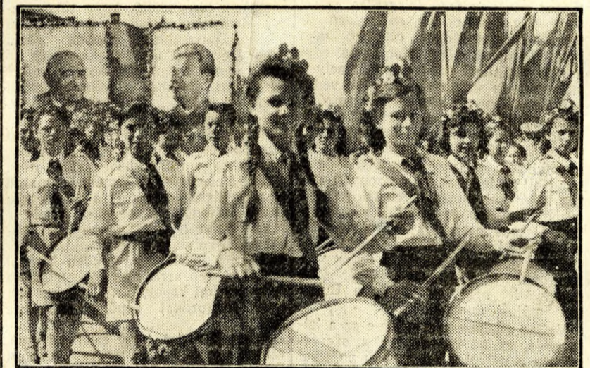
A boldogan, lelkesen felvonuló fiatalok élén úttörő dobosok haladtak