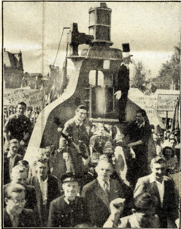
Rákosi Mátyás Művek hatalmas kalapácsa alatt Titót ábrázoló báb vergődik. A kalapács a dolgozók nagy tevézsége mellett újra és újra lesújt a népek gonosz ellenségeit ábrázoló bábra.