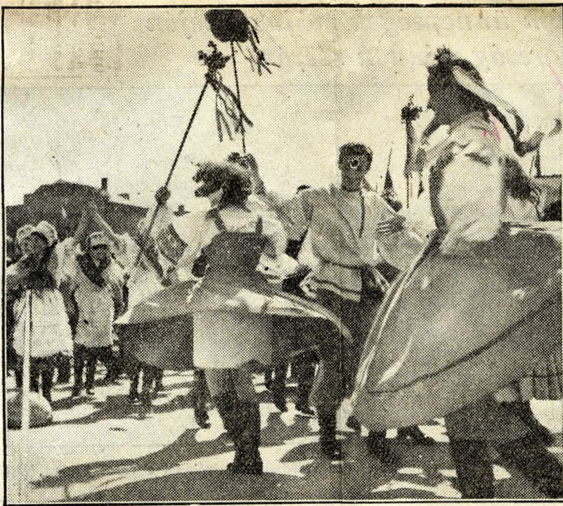
A menetben az üzemek kultúrscsoportjai pompás táncokat járnak