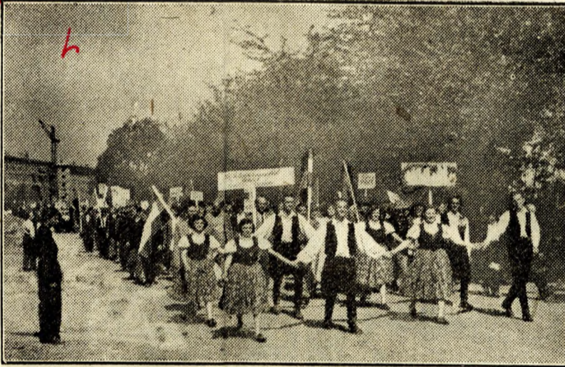
Sztálinváros utcáin május elsején vidáman vonulnak fel a város boldog építői

Öt óraja tart már a felvonulás, a menet a vége felé közeledik. A menetet bezáró üzemek után összekarolva, összefogóva, éljenzve, dalolva és hurrázva fiatalok, katonák jönnek. Vig nótájuk végigárad a téren, összecsendül a Városligetben daloló, táncoló, szórakozó tömeg idáig halló zsvajgásával s hirdeti ország-világ előtt a magyar munkásosztály, a magyar dolgozók boldog, napjaink életét, biztos hitét a holnapban, elszánt akaratát a béke megvédésére.