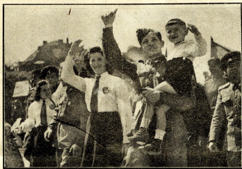
Honvédek együtt meneteltek az üzemek dolgozóival

csaknem 80.000 dolgozó vonult el az Arany Bika-szállónál felállított díszemlőny előtt. A hortobágyi állami gazdaság dolgozóit szemléltetve mutatták be, hogyan segítik és gyorsítják a gépek a mezőgazdasági dolgo-