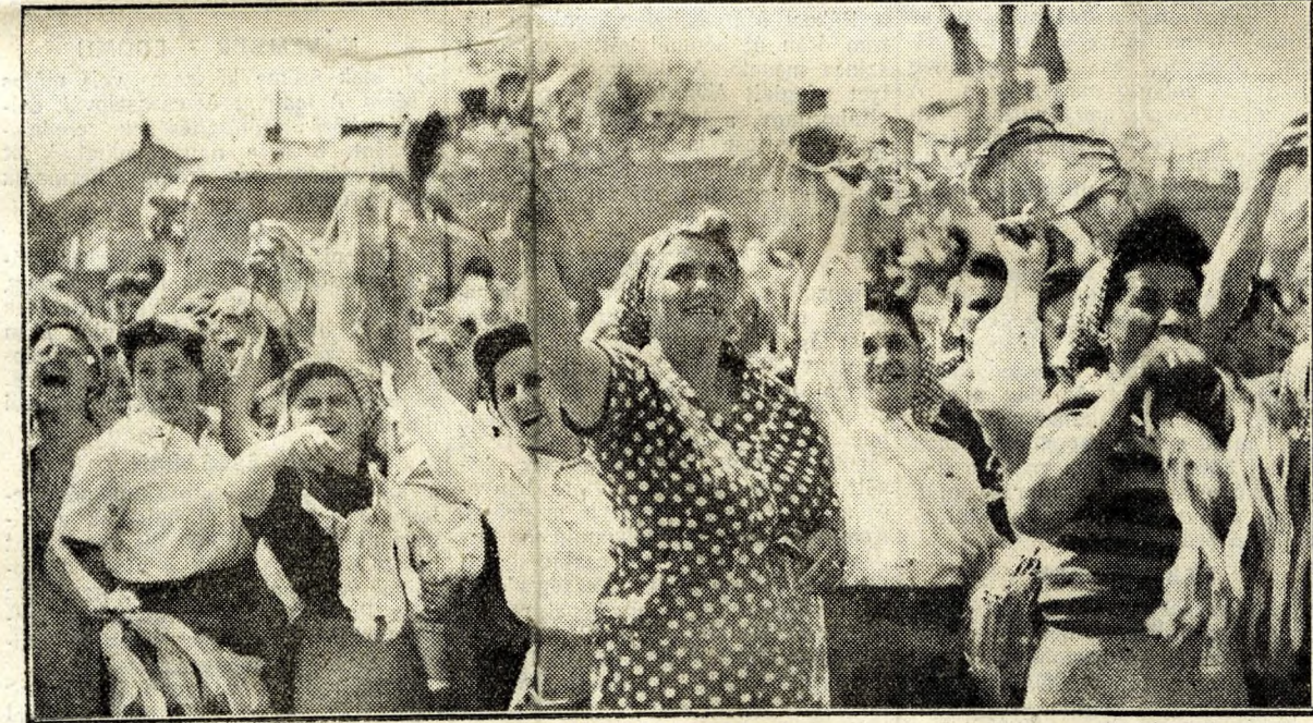
Felvonul az MNDSZ. Asszonyaink kitörő örömmel üdvözlik Rákosi elvtársat

táblát hoznak. Dülö-fülő kuláknak mutatja a táblán egy dolgozó paraszt — aki a gyár által készített rostálóval dolgozik —: „Mégis lesz liszta vetőmag!” Két hatalmas, csúf rovar hoznak a Fertőtlenítő dolgozói. Az undok férgek alatt felírás: „Truman katonái.” Mögöttük fertőtlenítő eszközökkel, fegyvelmezt sorokban jönnek a dolgozók. Felettük tábla hirdeti: „A fertőtlenítők legyőzik Truman katonáit!”