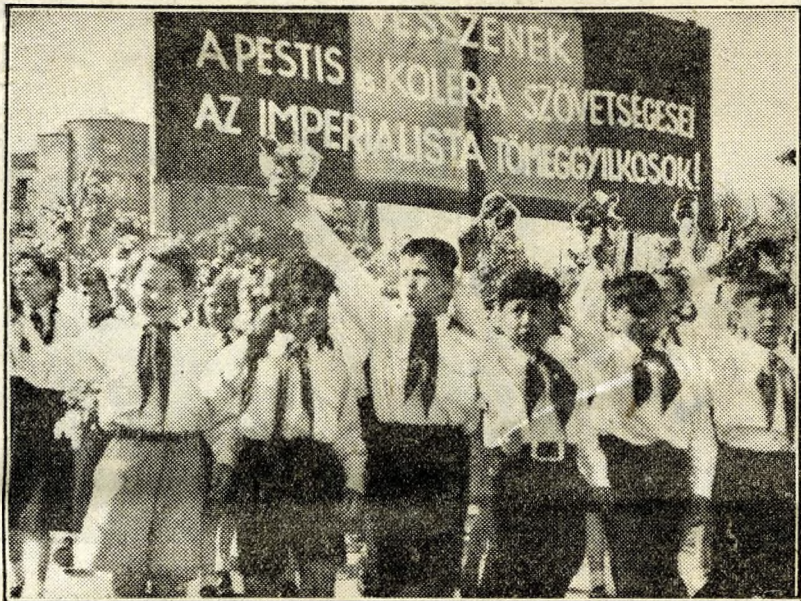
Együtt menetelnek a magyar és a koreai úttörők