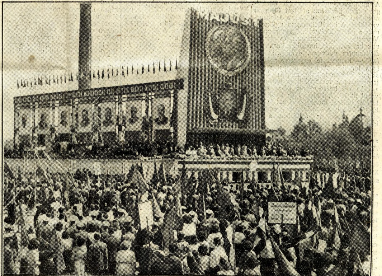
A dísztribün a Hősök tere