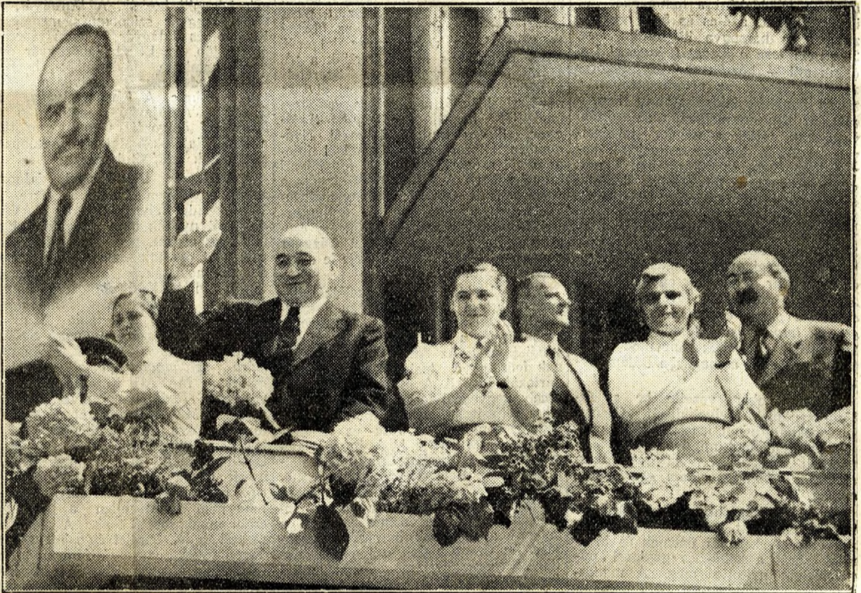
Rákosi elvtárs a dísztribün sarkáról üdvözlö a felvonuló asszonyokat. Rákosi elvtársról balra Benke Valéria elvtársnő, az Országos Béketanács titkára, jobbra Nagy Mária elvtársnő, a Budapesti Pártbizottság másodtitkára, Pongrácz Kálmán elvtárs, a Budapesti Tanács elnöke, Vass Istvánné elvtársnő, az MNDSZ főtitkára, a Központi Vezetőség tagjai és Nagy Imre elvtárs, a Politikai Bizottság tagja

Büszkék vagyunk Budapest dolgozóira, akik fegyelmességükkel és harcoságukkal, ötletességükkel és egetverő lelkesedésükkel szebbé tették ezt az ünnepet, mint amelyet bármikor is május elsején végigéltünk. Büszkék vagyunk hazánk öntudatos fiaira és leányaira, akik erők diadalmas megmutatásával, népünk hatalmas seregszemléjévé tették ezt a napot. Előre továbbra is azon az úton, amelynek május 1 oly világító fényességű ünnepe: a nemzetköziség és az alkotómunka útján!