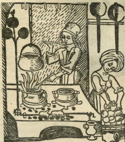
Régi szakácskönyv címlapja 1507-ből.

Am ahhoz is, hogy végigjárjuk ezt a képzeltbeli gasztronómiai utat, ahhoz az élményhez is a Várat kell fölkeres- nünk. A Fortuna utca 4. szám alatti há- zat, a Vendéglátóipari Múzeumot, ahol elcsíphetünk egy-egy hangulatot a múlt idők vendéglőiből, kiskocsmáiból, cuk- rászdáiból, kávéházaiból, szállodáiból. Akad közöttük olyan is, amelyre már csak itt a múzeumban emlékezhetünk: az igazi budai kiskocsmá, ahol Rezeda Kázmér és Nagybotos Viola, Krúdy hő- sei itták borukat, vagy a valódi pesti kávéház — mint például a Centrál, ahol