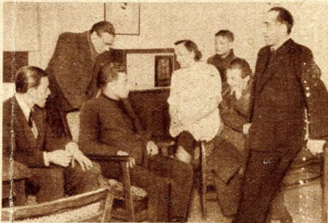
Szóll a rádió a Rákosi-kulturház társalgójában...

játékszoba... Az ablakon keresztül a József Attila-térre látunk. Ott nagyban folyik a munka. Nyárra már itt áll az angyalföldi szabadtéri kultúrpark. Az 1500 személyes nézőtér és a színpad földmunkálataival máris elkészültek. A színpad mögött fásított területet látunk. — Ott könyvsátrak és olvasólugasok várják majd Angyalföld pihenő, tanuló mun-