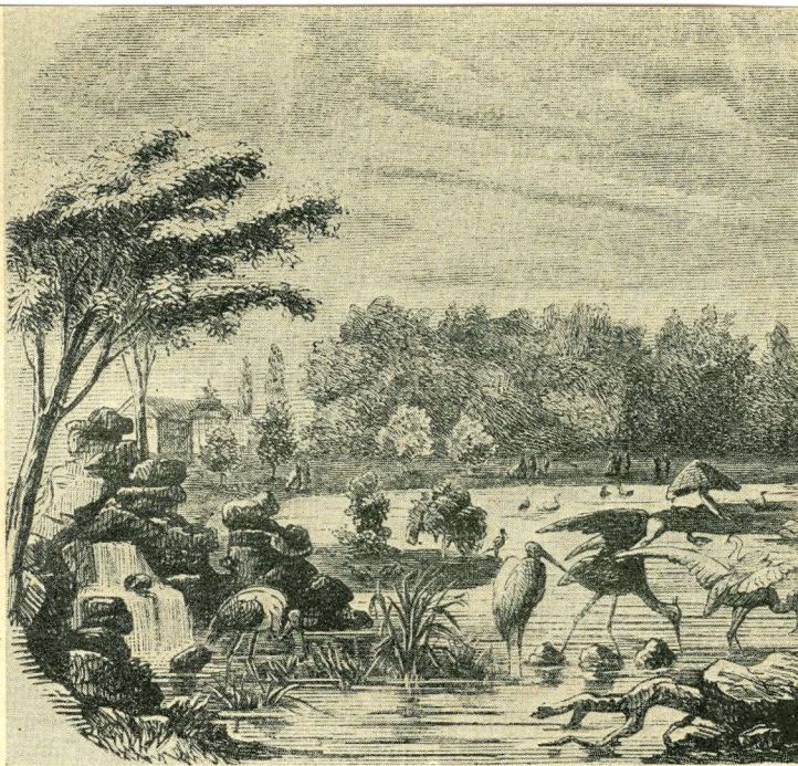
Az állatkerti tó

A középkorban különösen a münzbergi (1433) és a friedbergi (1489) kertek voltak híresek, főként szarvastenyészetükről. Bécs mellett, Ebersdorfban 1552-ben volt már állatkert. A schönbrunni állatkertet 1752-ben alapították. A híres párizsi Jardin des plan-