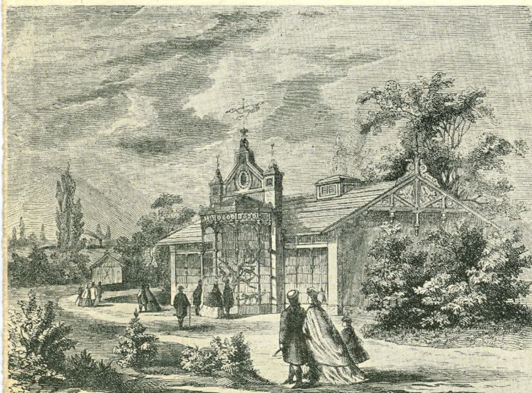
A majmok háza

Új korszak, szebb napok viradtak az Állatkertre, mert a főváros 1909-ben többmillió koronás költséggel újraépíttette és fenntartási költségeire mindjárt az első évben 220,000 koronát szavazott meg.