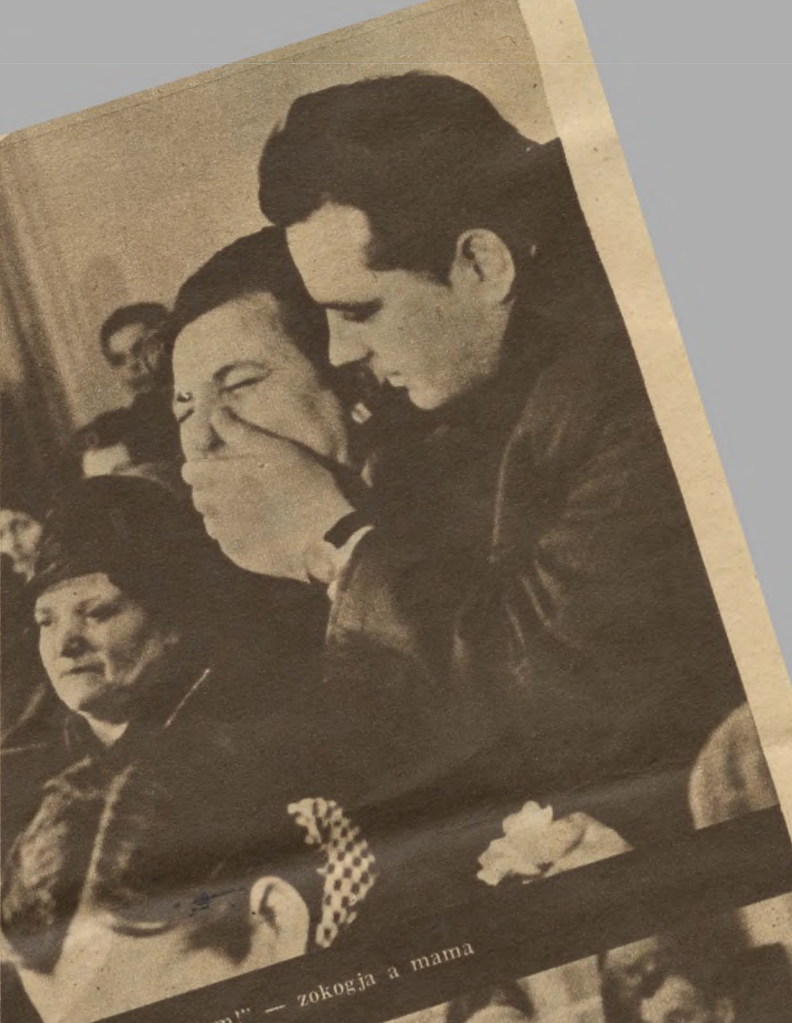
„Jaj, ó, édes fiam!” — zokogja a mama