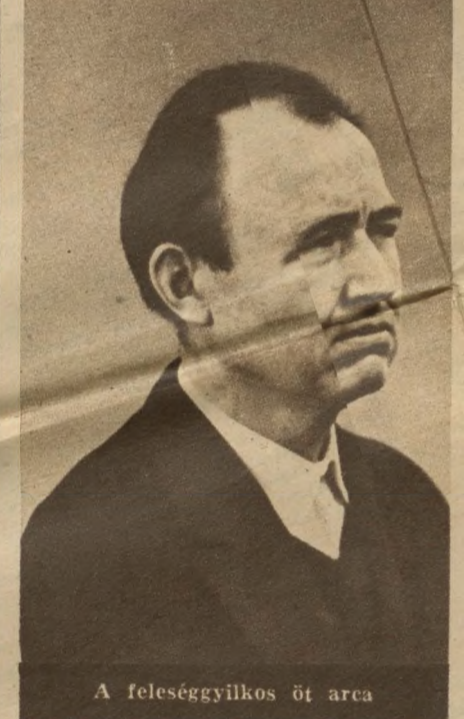
A feleséggyilkos öt arca