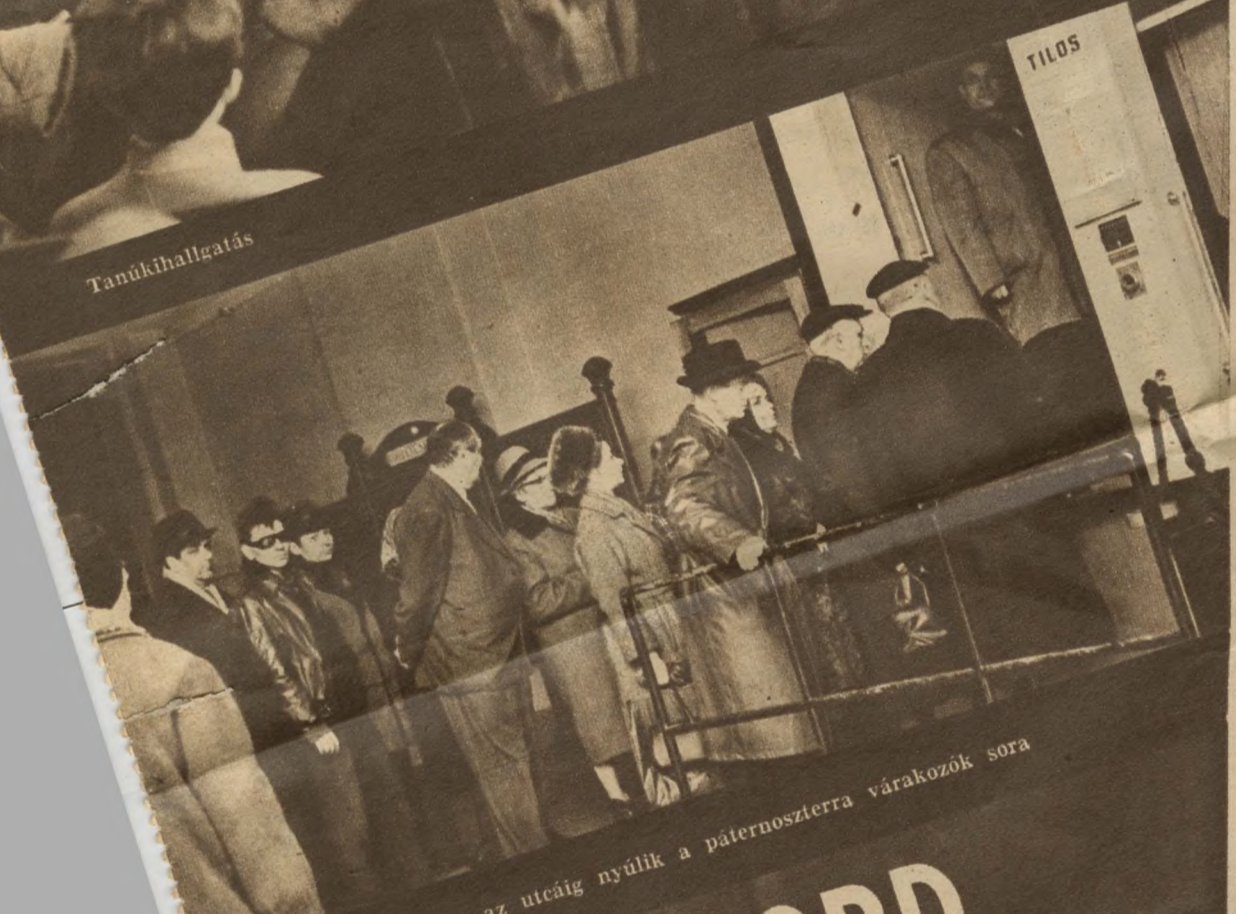
Reggel sokszor az utcáig nyúlik a páternosztásra várakozók sora