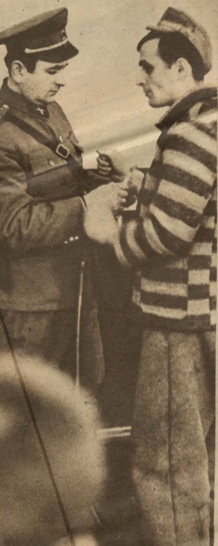
A tárgyalás kezdetén a letartóztatottól leveszik a bilincset