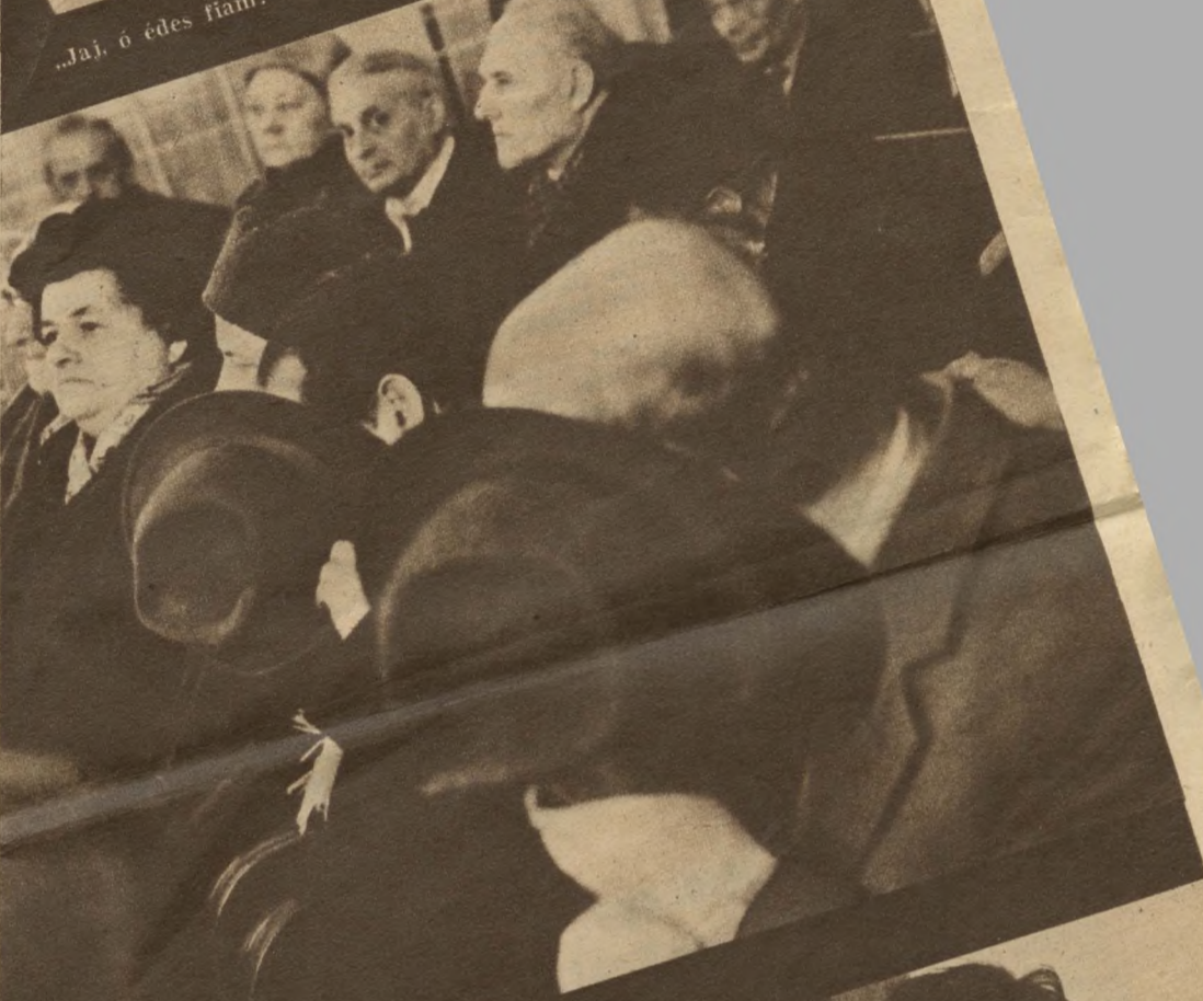
A tárgyalás hallgatói