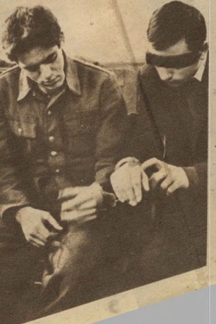
A tárgyalás szünetében