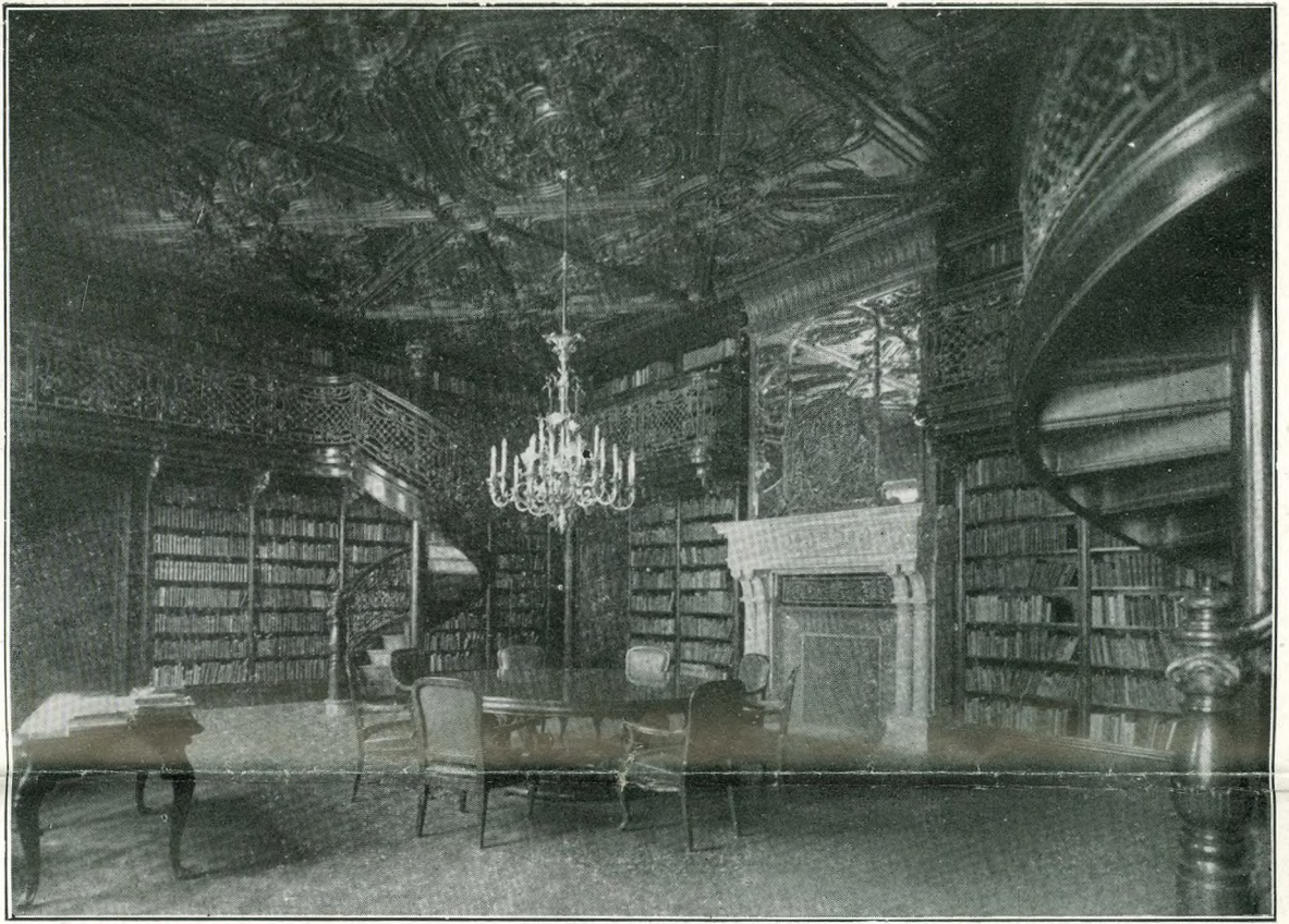
Az új Fővárosi Könyvtárban az úgynevezett keleti gyűjtemény tele van fafaragású díszítésekkel. A mennyezet, csigalépcsők, csillár és kandalló kiképzése iparművészeti remekmű

berek és a feljárónál van Fadrusz remek szoborműve.