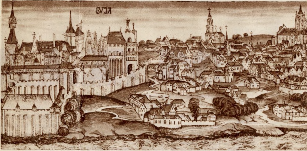
Buda híres várának legrégebbi ábrázolása. Ez a kép a Hartmann—Schedel krónikában jelent meg. Valószínűleg Michael Wohlgemuth nürnbergi fametsző műve

A három- és ötéves tervek építkezései megteremtették a lehetőségeket Buda történelmi múltjának feltárására.