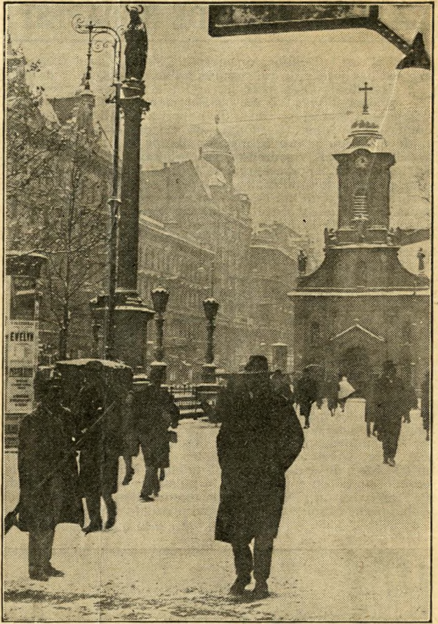
La rue Rakoczy, à Budapest, un matin neigeux d'hiver.

— Regarde, voilà ce qui l'arrivera si tu continues à te ronger les ongles !