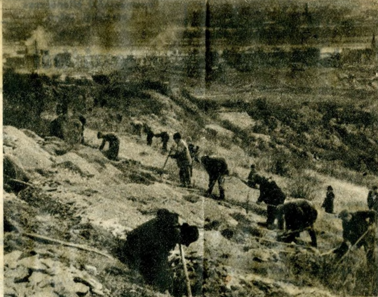
Szikla, gyom, alacsony bozót borítja a hegyet, ameddig a szem ellát. Néhány év múlva már fák jelzik majd itt is az alkotó munkát