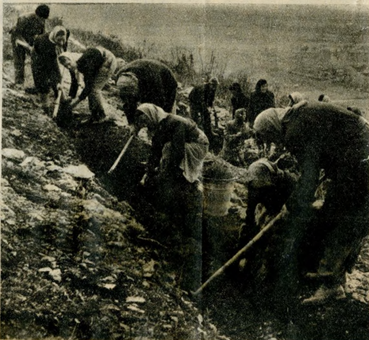
Hosszú árkokat ásnak a hegyoldalba, jól előkészítik a földet a csemetéknek