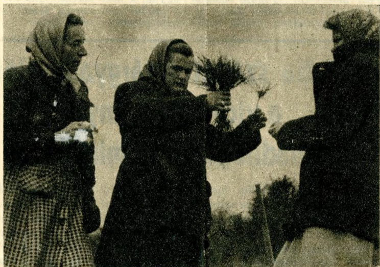
Ültetés előtt gondosan átvizsgálják a csöpp facsemetéket. A vékony hajszálgökök hamar megkapaszkodnak majd a földben és a Mátyáshegyen pár év múlva felnő, megizmosodik a város új »tüdeje«