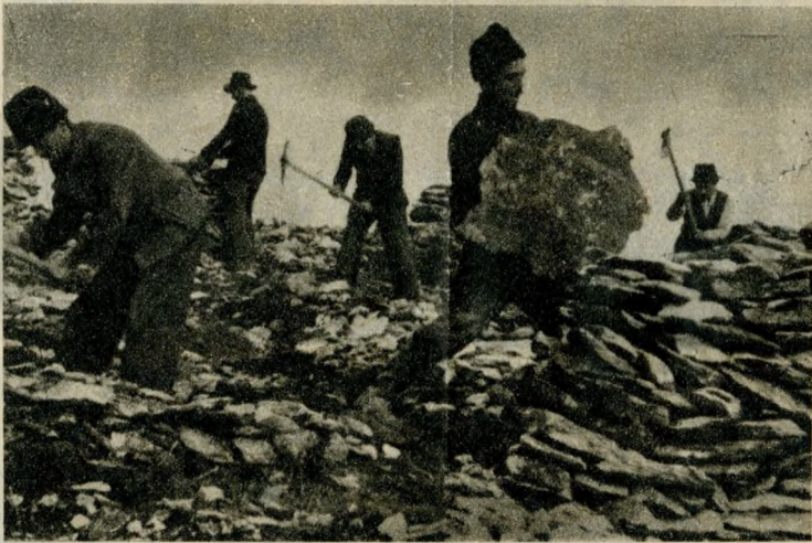
A kopár hegyet előbb termővé teszik. A sziklák helyén árnyat adó fák nőnek majd

A kopár hegycsúcsot teljesen megtisztítják a kövektől, szikláktól és beültetik feketefenyővel. A mátyáshegyi erdő a város levegőjét is tisztítja majd, az északnyugati irányból fújó szél ugyanis elviszi a friss, ózon illatot a füstös levegőjű utcákba.