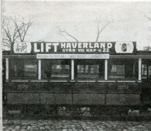
A Haverland-cég reklámja a 6-os villamoson