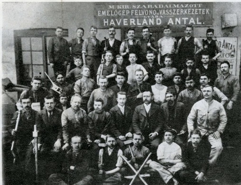
A Nap utcai gépműhely dolgozói

Halála után, 1935-ben fia, Haverland Tivadar vette át a gyár vezetését. A munkát az első világháborúból való leszerelése után kezdte meg édesapja vállalatánál. Előbb szerkesztő-rajzoló, majd önálló tervező. 1944 első felében az iparügyi miniszter a gyár gépeinek leszerelésére és Nyugatra való át-