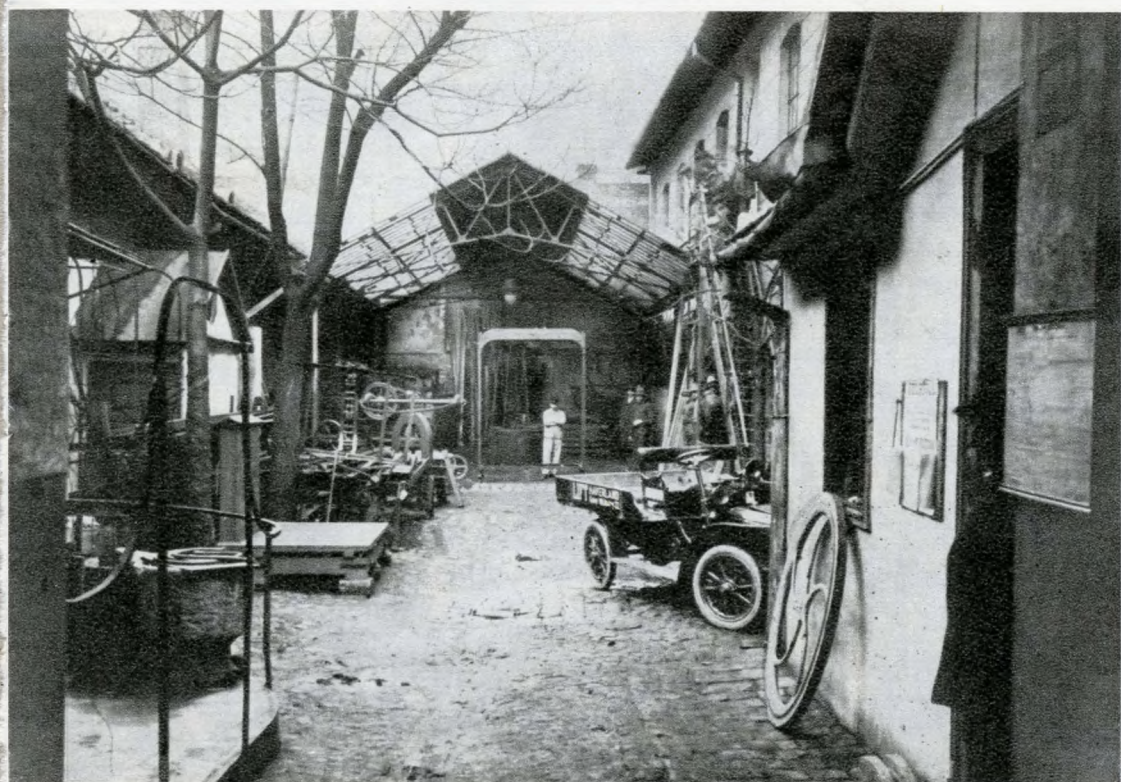
A Nap utcai gyár udvara