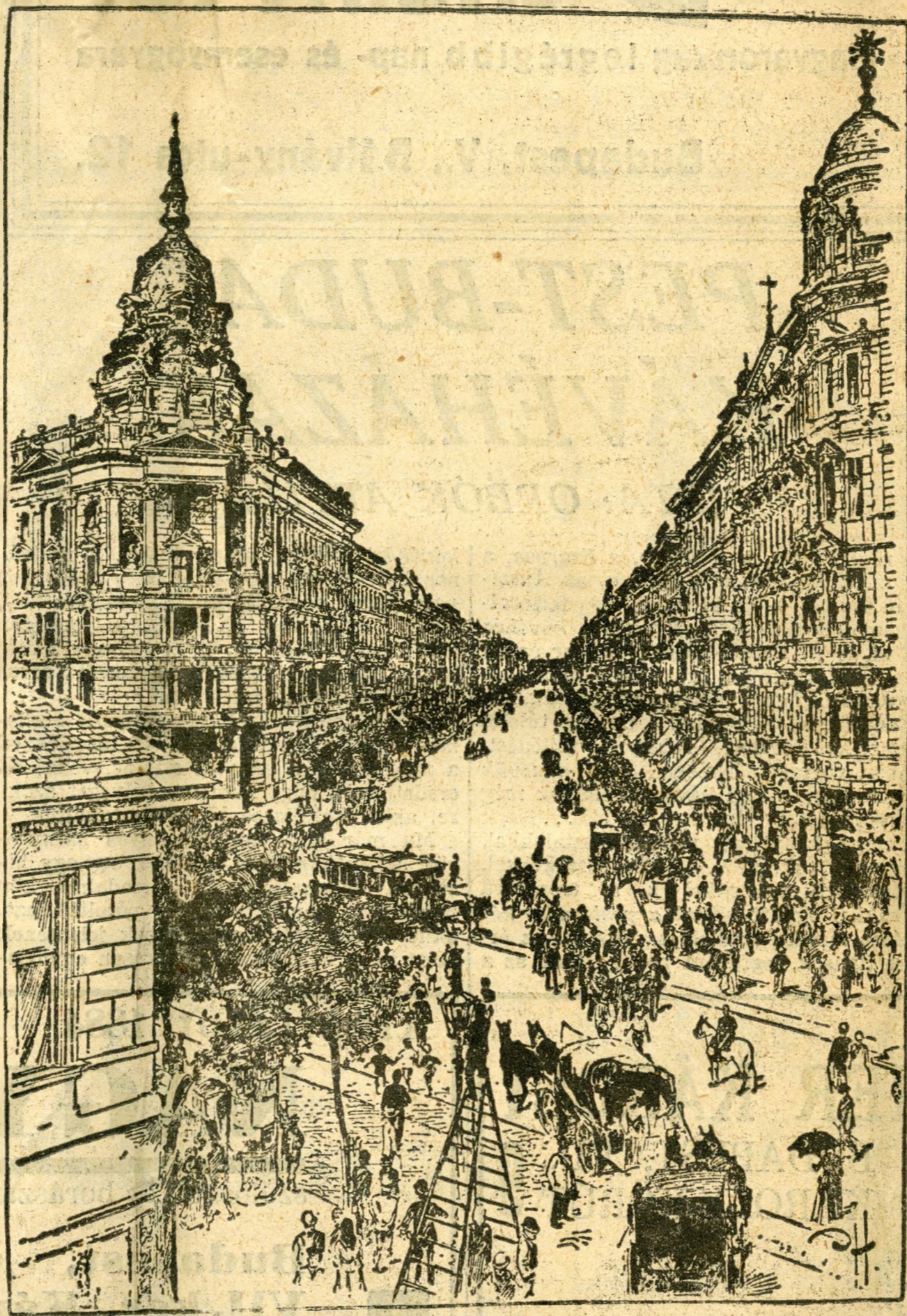
Az Andrássy-út a lóvasút korában

De innen, negyven esztendőnek a távolából mégis fölemelő az emlék és lenyűgöző a kép. Tavasztól őszig, május 2-tól október 31-ig ünnepelt a nemzet — ezen a napon, az ezeréves országos kiállítás bezárulásával ért véget a milleniumi év — és a kezdetnek, a bizakodásnak, a további munkálkodásnak, a történelmi küldetés büszke kinyilatkoztatásának ezalatt a hat hónapja alatt az országgyűlés két háza a nemzet egyetemes akaratként csaknem mindennap maradó alkotással készült a második ezredévre. De az elhatározás csaknem minden megszólalásában elvi kérdést érintett és csupán eszmei magaslaton mozgott. Hangjában, főként stílusában és előkelőségében a szellem játéka volt csupán és minden számottevő és nagy alkotásában a gondolat hivatottságát szolgálta, nem pedig az igazi