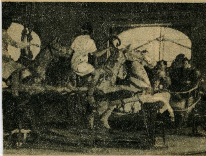
Akik magas lóról tekintettek le ránk

Általában, ha a század elején egyáltalában lehetett demokráciáról beszélni, a Városliget volt az egyetlen igazán demokratikus hely. Itt van például a vurstli. Mutatványos bódék pódiumán színes trikóban álltak egymás mellett a kiképzők és előtűk körbe oszobák és nagyságák, közlegények és katonatisztek, munkások és úrlak. Egyformán álmétkodva és ünnepleten hallgatták Liliomot, amikor így csábította a közönséget: »Hát lebei urak folyvást, folyvást! Itt látható az orriás kígyó! Fejétől a farkáig tíz méter, farkától a fejéig húsz méter, összesen ötven méter! A ringhupilon sem volt osztálykülönbség. Felült biz arra mindenki, aki magas lóról akart letakinteni a világra. A barlangvasút sárkányvonatára is felültünk, hogy néhány percre elgyönyörködjünk egy fantasztikus tündérvilágban... no meg, hogy egy-két csókot is lopjunk a fűzőben feszengő imádottunktól. Elpusztult a Foszty-körkép is, amelyen annyiszor csodálunk meg áhítattal Árpád apánk bejövetelet. A panoptikum viaszabái már kevesebb vonzóerővel bírtak. A gyengébb idegzetűek nem bírták el