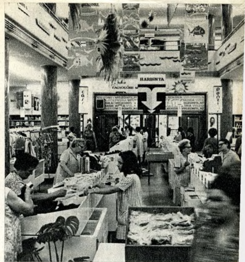
Az Újpesti Áruház