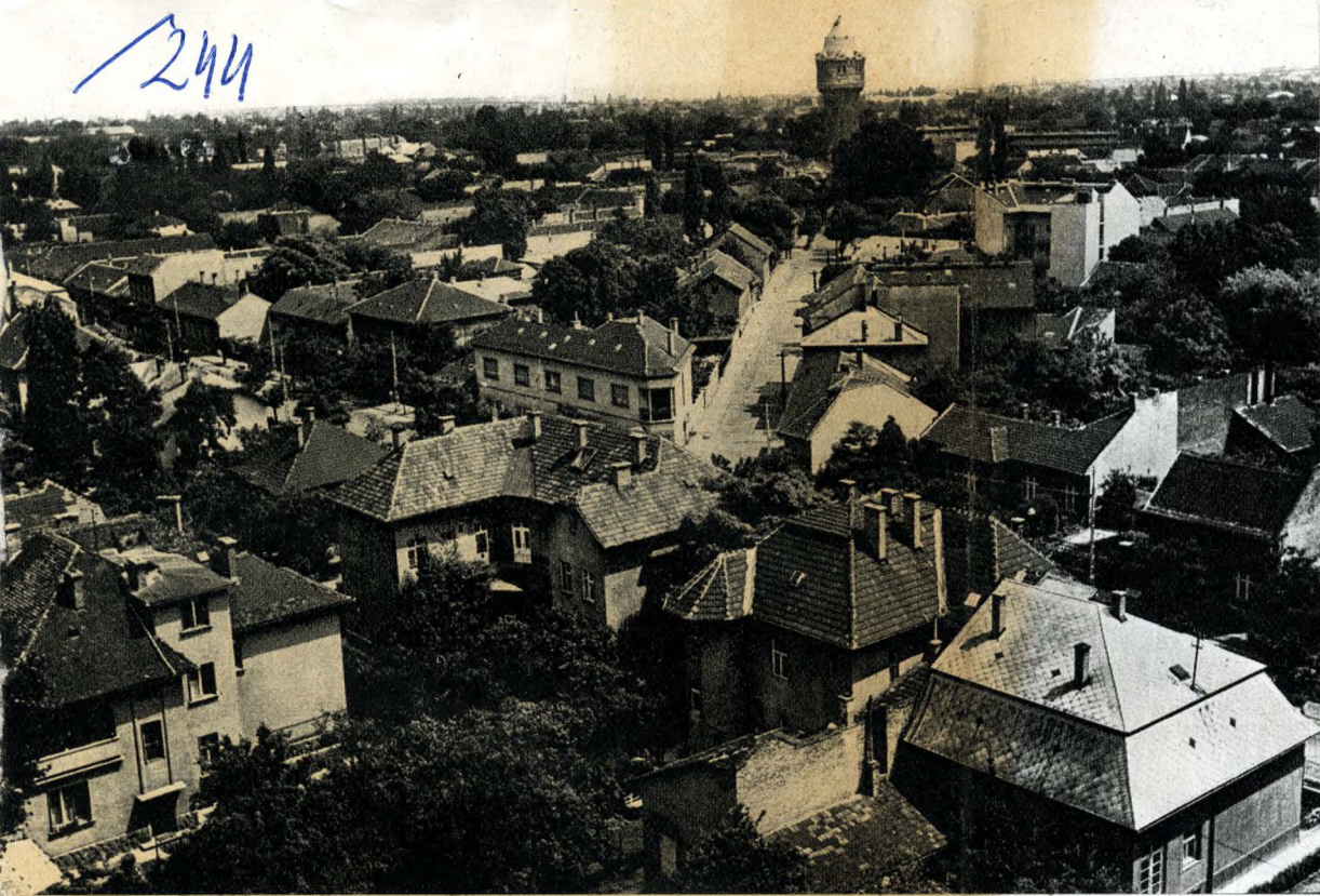
Csigó László felvételei