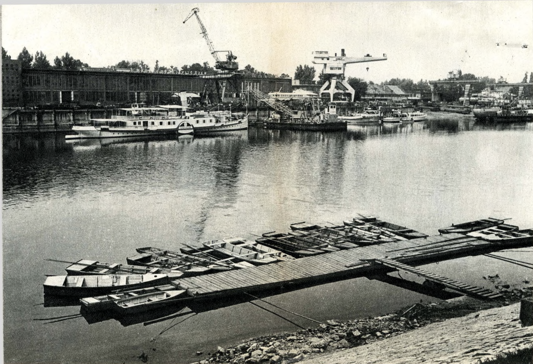
A hajóavító üzem