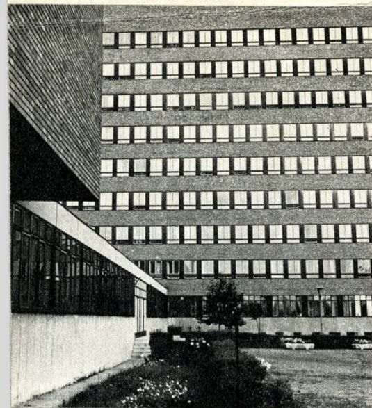
Az MTA Kutató Intézete a Fóti úton

Az a szociológiai vizsgálódás, amelyet két esztendeje végeztek el a kerületben, ismét csak megkülönbözteti Újpestet a Józsefvárostól. Elsősorban a laksűrűség és az életforma tekintetében. Az újpesti földszintes bérházak tömkelegében, a kis belső udvarokban élnek társadalmi életüket az emberek: munka után, vasárnaponként ott beszélnek meg a világ dolgait, játsszák véget nem érő ulti- és sakpartijaikat a férfiak, tereferélnek sámlin üldögélve az asszonyok. A 25–30 család gyerektől öregkorig tartó meghitt emberi együttélésébe természetesen a fiatalok is beletartoznak, ők is az udvaron ismerkednek össze, a házasságkötés után pedig csak az a kérdés, hogy melyik szülőhöz, pontosan