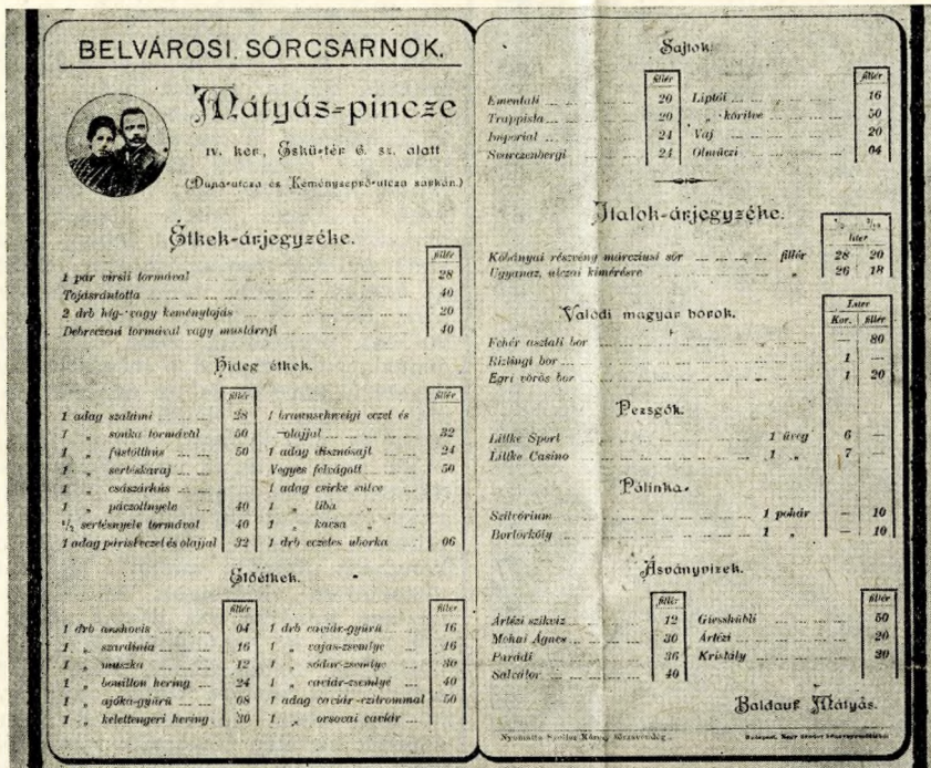
A Mátyás Pince 1904. január 30-i megnyitásának napján érvényben volt árak (A jubileumi étlap hátoldala)