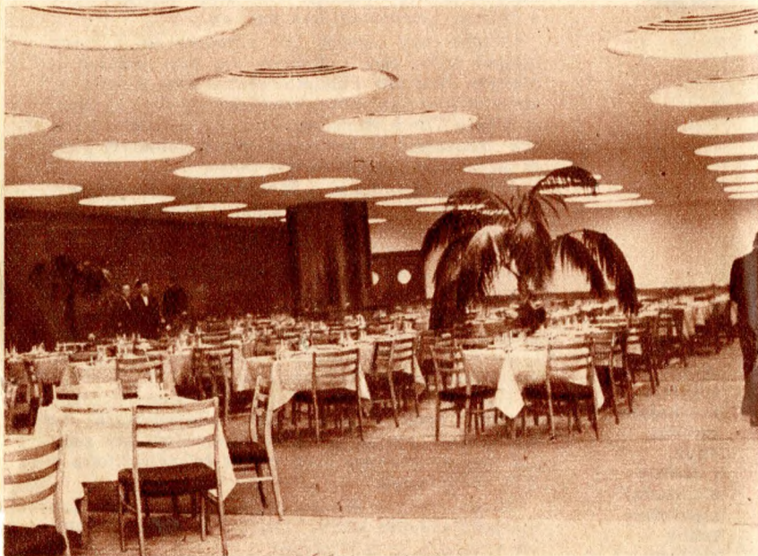
Az új szálloda korszerűen világított, szépen berendezett étterme