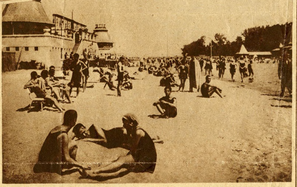
Les baigneurs sur la plage avant le bain.

Non loin, le bateau-mouche qui vient de Vienne fend doucement le fleuve. Son pa-