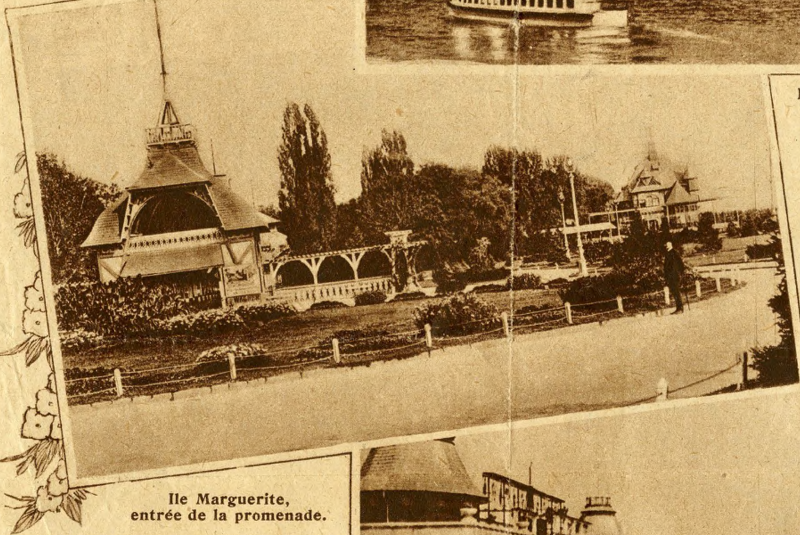
Ile Marguerite, entrée de la promenade.

trouvent des salles de jeux avec orchestres de tziganes, un confortable établissement de bains en pleine eau, est édifié. Une plage de sable fin artificiellement aménagée en pente douce, entoure une vaste pièce d'eau, alimentée et sans cesse renouvelée, par les flots bleus du Danube.