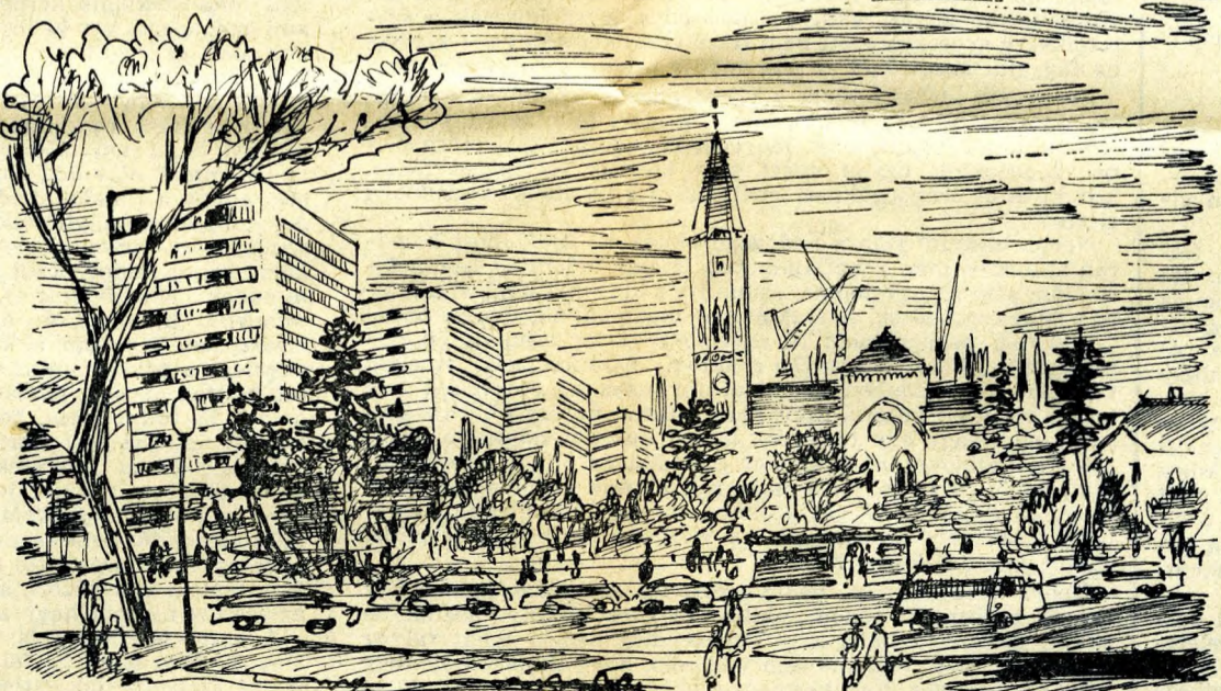
V. (1926. L. 77.)