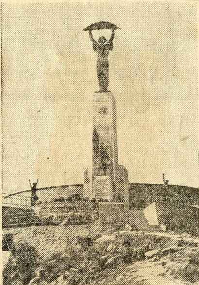
Socha Svobody na Gelertově hoře v Budapešti. Mohutný památník díky sovětské armádě za osvobození Maďarska od nacistického panství.