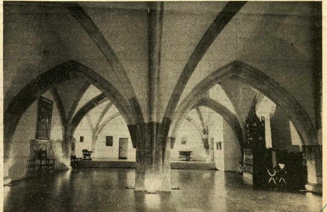
Die Burg von Buda (1470 und 1737 — oben); der Burghügel heute (mit türkischen Grabsteinen, links); Gotischer Saal, heute Museum (rechts); Glanz und Elend der Geschichte Ungarns