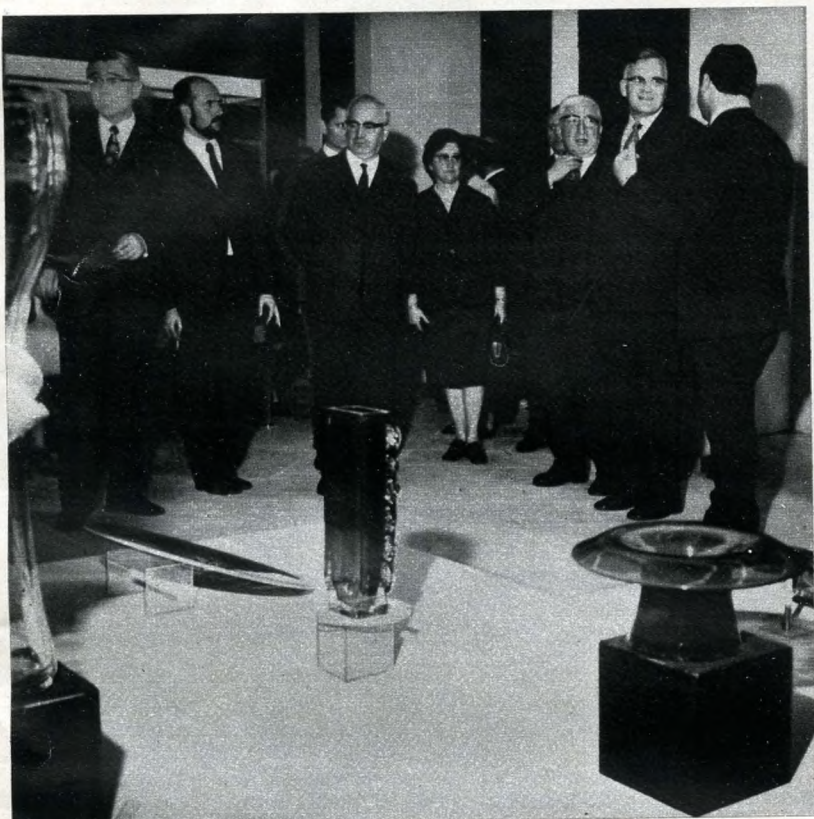
A résztvevők első útja a földszinti kiállítóterembe vezetett