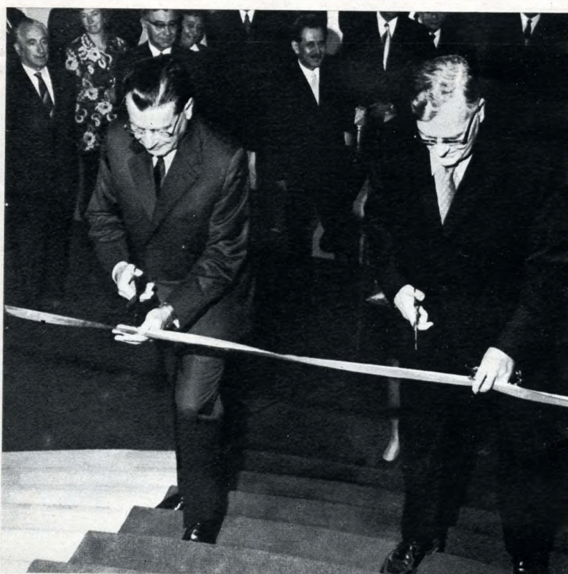
A szovjet és a magyar kormány nevében a két miniszterelnök-helyettes egyszerre vágja át a vörös és a piros-fehér-zöld színű szalagot

November 9-én pénteken ünnepélyes külsőségek között megnyitották Budapesten a Szovjet Kultúra és Tudomány Házát. A Kosuth Lajos utca – Semmelweis utca sarkán létesített új intézmény díszes előcsarnokában délelőtt 10 órakor gyülekeztek a meghívottak, köztük a magyar és a szovjet szellemi és kulturális élet számos kiválósága.