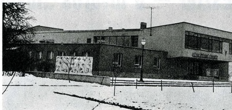
A „Dózsa” Művelődési Ház

nem az oda kifelé tartó autóbuszok is — mint az illetékes szakemberek is megállapították — „minden tekintetben zsúfoltnak mondhatók”. De hát a minden tekintetben gyenge XVII. kerületi közlekedésről cikkünkben is — és hivatalosabb fórumokon is — már sok szó esett.