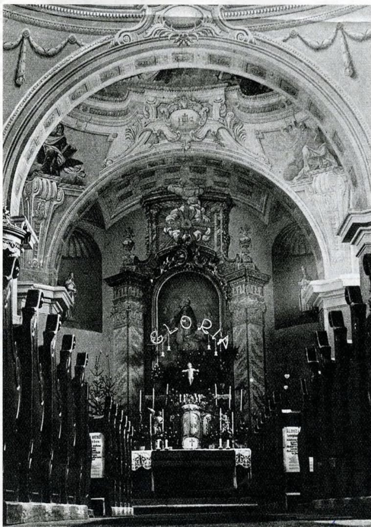
A római katolikus templom belseje (1740)