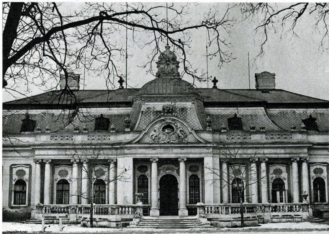
A Vigyázó (volt Podmaniczky) kastély 1760 körüli barokk épülete

forma Budapesttel. Aztán még lejjebb ereszkedik a gép, egészen leereszkedik, ide, a földre, a kerület határába — és akkor már látszik, hogy hát azért még egy és más elkélne ahhoz, hogy ne csak „a XVII. kerület” legyünk, hanem valóban Budapest Főváros XVII. kerületévé fejlődjünk.