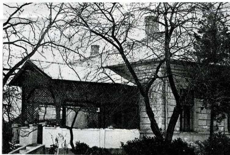
A Hunyadi utcai Bartók-ház