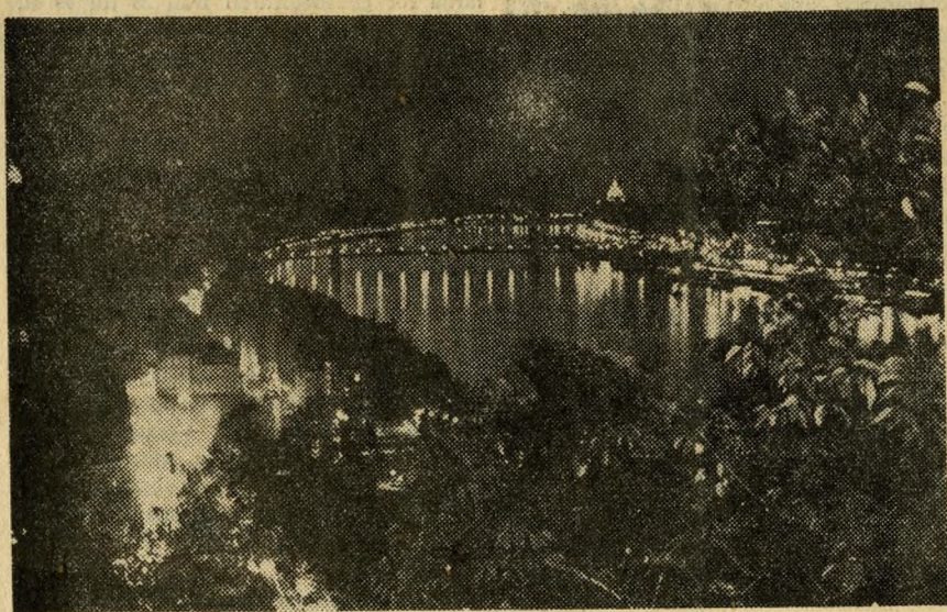
Budapest by night...