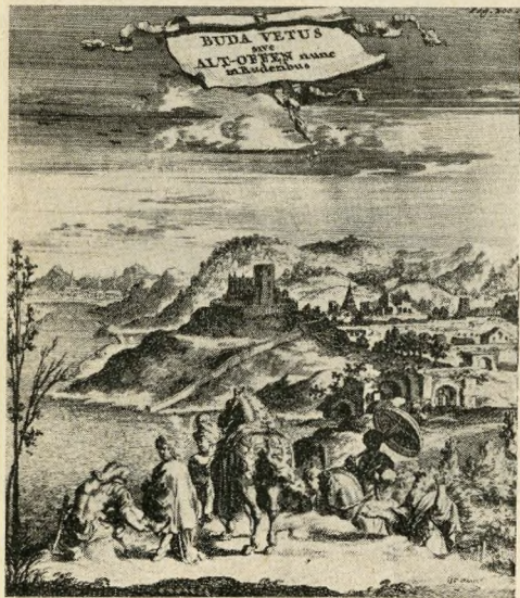
Buda a török időkben, észak (kb. a Rózsadomb) felől

lyamot elzárta volna. Ugylátszik, az Ecluse várkastély mellett épült burgundi tornyot akarja utánozni, tervét azonban kivihetetlennek tartom, mivel a folyam