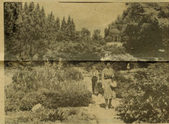
Tavaszi napsütésben séta a tavak mentén. Háttérben a zenélő kút.