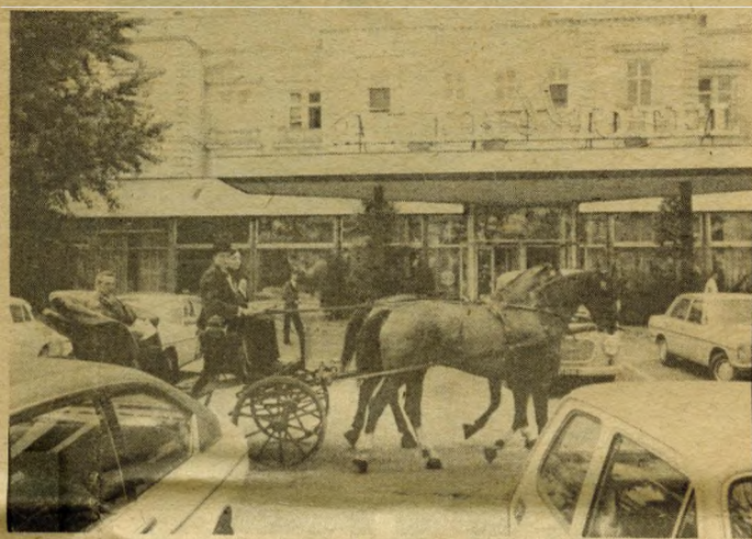
A flakker a Margitszigeti Nagyszálló előtt a századforduló hangulatát idézi.

A gyerekeké lett a sziget! Krúdy Gyula az Érdekes Újságban így számol be erről a honfoglalásról: „A sziget közepén állt egy sárga, kopott varjúfészek, hideg és rozsdás udvarház, amelyet még manapság is Kastélynak neveznek, mert egykor benne lakott egy öregember, amikor még hercegek voltak a Margitszigeten. Ezen a tavaszon kinyílt a pókhálós ablak az udvarházon, meg, hőkent a kapu, a varjúkárogástól életűnt kémény felfigyelt, a vijjogó vércse riadtan menekült, még tán a romfal is nagyot nézett, pedig sok mindent látott ezer esztendő alatt...: víg gyermekcsapat özönlötte el az udvarház környékét. Minden nap vígabb, bátrabb, hangosabb gyerekek nőttek ki itt a fűből, valamely varázslat történt itt; a meséskönyv megelevenedett. Pajkos, rongyos kisfiúk egy délután méhkast hoztak kis kézikocsin az életűnt szigetre és hangos hajrával felborították a vidáman zümmögő kast...”