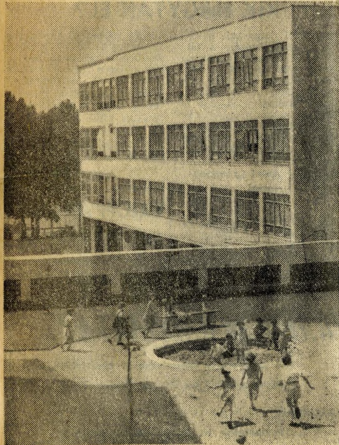
AZ ÚJ SZÉKHÁZ A VILLÁNYI ÚTI LAKÓTELEP FELŐL.

Az Építéstudományi Intézet nemrég felépült igazgatósági épületén tucatnyi érdekes megoldást alkalmaztak. A háromemeletes épület vasbeton födemeleseit teljes hosszúságban végigfutó huzalokkal utólag, egy ütemben feszítették meg. Műanyagokból készítették a lépcsők bevonatát, a szobák padlózatát, s vonták be a beépített bútorokat is. Műanyag épületfalakat alkalmaztak, kilincset, ajtót. A távfűtési hálózatba bekapcsolt házban légfűtés van, kis lyukakon fűjtatják be a szobába a meleg levegőt. Budapest egyik legkorszerűbb épülete modern vonalával jól illeszkedik a környező városképbe.