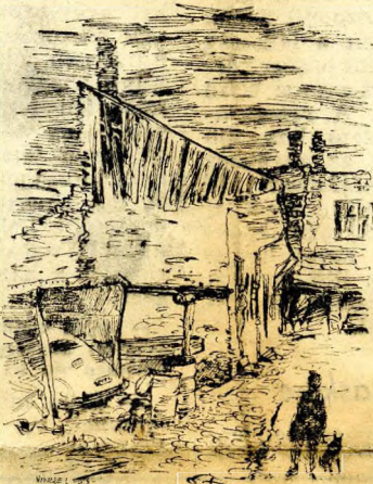
Régi ferencvárosi udvar

fogja képezni a föld szivdobogását, mely bennünket ébren lenni kész. Terjeszkedni fog az égsark minden része felé a kővé vált élet, a sirokat beépítik utcasorokkal! Az elvetett magból cédrusfa lesz!... És lesz népiünk, mely hazájának örül, mely nevének dicsére munkál, lesznek nagy embereink, kiket a világ bámulni fog, lesznek hőseink, dicső szellemeink, lesz életünk, melynek szük lesz ez a város, leszünk nemzet, mint még sosem...”