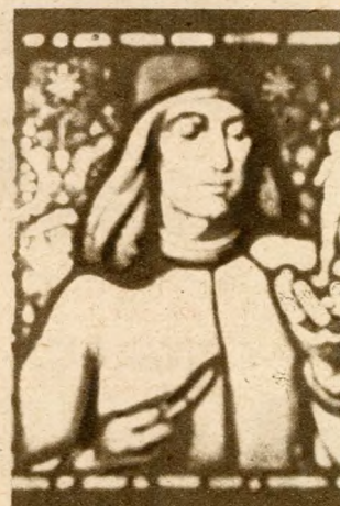
Ez az üvegfestmény a Nefelejts utcai műhelyben készült