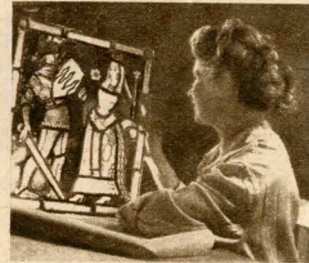
Készül a színes üvegmozajk