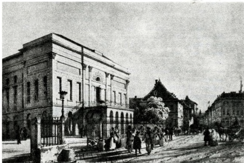
Metszetek a korabeli Pestről

Az első félév cikkei erősen hatottak a közvéleményre. Az érdeklődés-kielégítésére elhatározza a szerkesztőség az addig megjelent számok újbóli (második) kiadását. Ritka eset még az egyetemes újságkiadás törté-