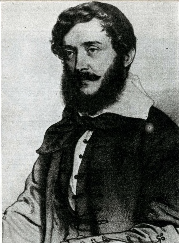
Kossuth Lajos az 1840-es évek elején

Valóban az következett — és nem is akármilyen „dolog” —, amire Kossuth beköszöntő szavát adta. Már az első számok után kétségbeesve kér-