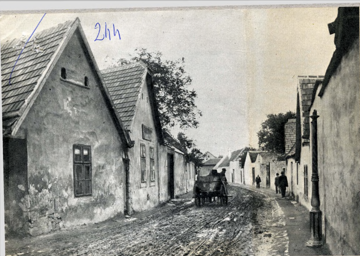
A XVIII. század közepén épült zsellér-utca