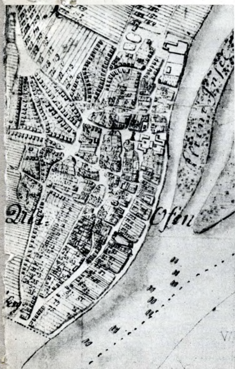
Az óbudai belterület térképe 1778-ban (részlet Kneidinger térképéből)

terjedelmi okokból itt csak utalni tudunk ezekre az összefüggésekre.