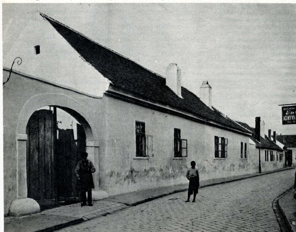
Az egykori Serfőző (1874 előtt Molnár) utca a XIX. század végén

A Dunához közel — nagyjából a ma is álló Zichy-kastély helyén — állt a XVII. század végén a Zichy-uradalom első óbudai majorsága, amelyben a majorgazda lakásán kívül helyet kapott a gabonacsűr és a prэшház is. (Az újabb ásatások tanúsága