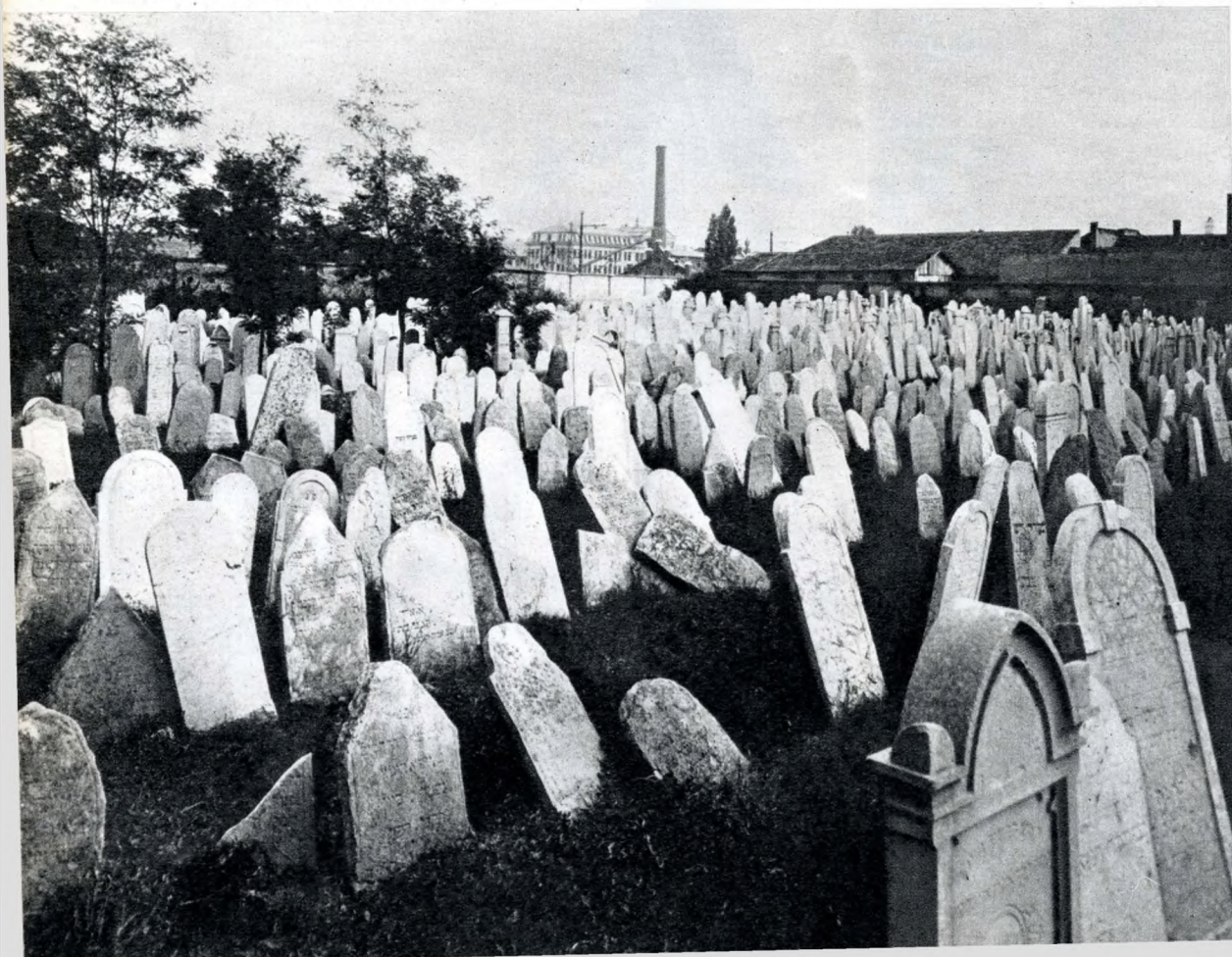
A Laktanya utcai volt zsidó temető

Napjainkban, amikor Budapest egyik legrégebbi városrészét gyökeresen átalakították — nemcsak a régi házakat tüntetve el, hanem az ősi utcahálózatot is — érdeklődésre tarthat számot a „rég Óbuda” felidézése.