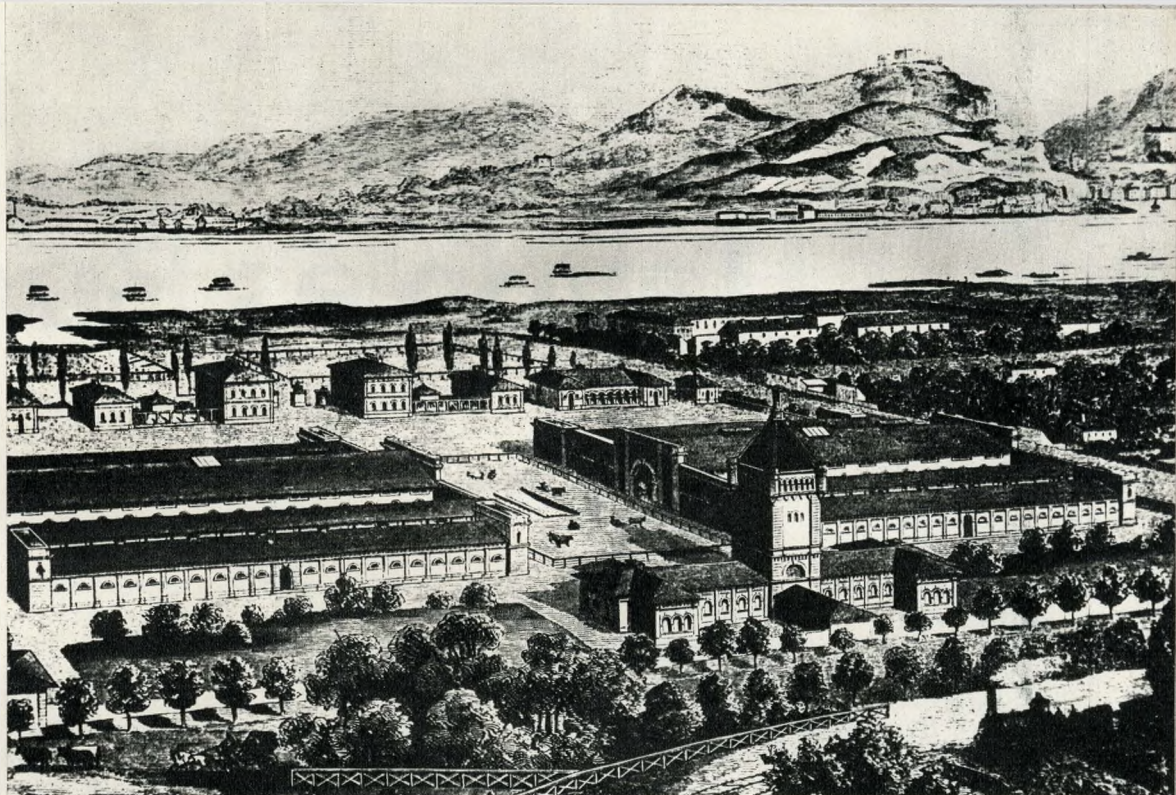
A Kőzvágóhíd látképe

A város-egyesítés éveiben, 1872–73-ban dühöngő kolera Pesten 2215 halottat követel. A lakásán elhalt 1195 személyből a Belvárosban csak minden 639 emberre jutott egy; ez a szám a Terézvárosban 212-re, a Józsefvárosban már 111-re, a Ferencvárosban 60-ra, Kőbányán 41-re (!) változik. Budán ugyanekkor a kisebb laksűrűség némileg jobban megkímélte a népességet. Pest 1,3%-os halandóságával szemben Budán (Óbudával együtt) a halandóság csak 1,1% volt; ezen belül is a tulajdonképpen Budán csak 0,97%, míg a főleg munkások és napszámosok lakta Óbudán 1,9% a halandóság. Budán