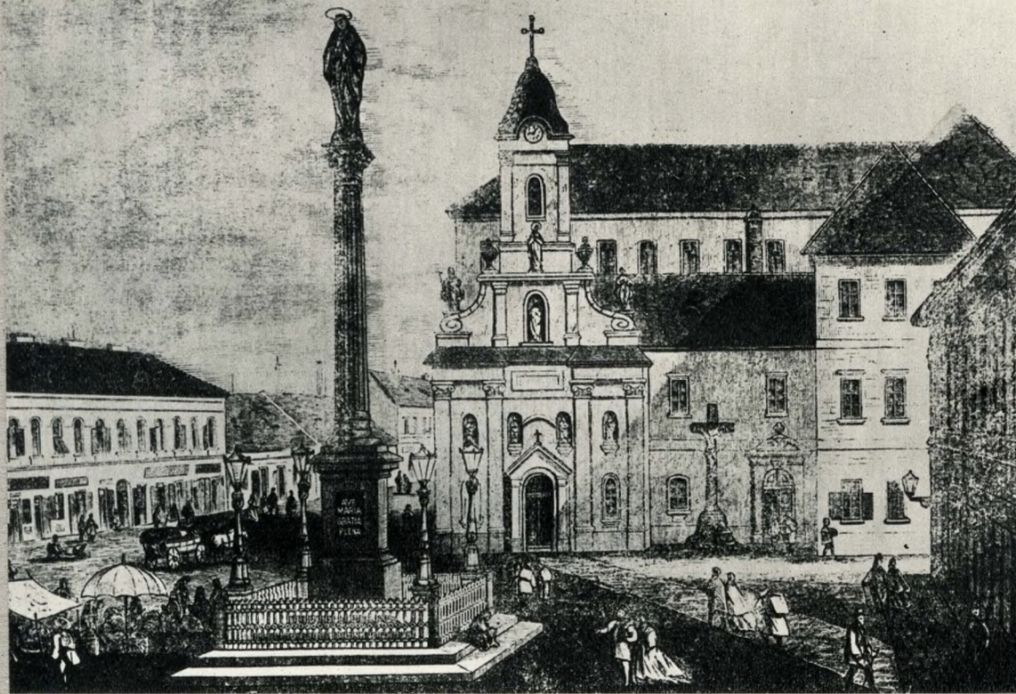
A Rókus Kórház

ben az átlag életkort és a 100 halott közül orvosi segély nélkül elhaltak számát illetőleg az alábbi táblázatot kapjuk: