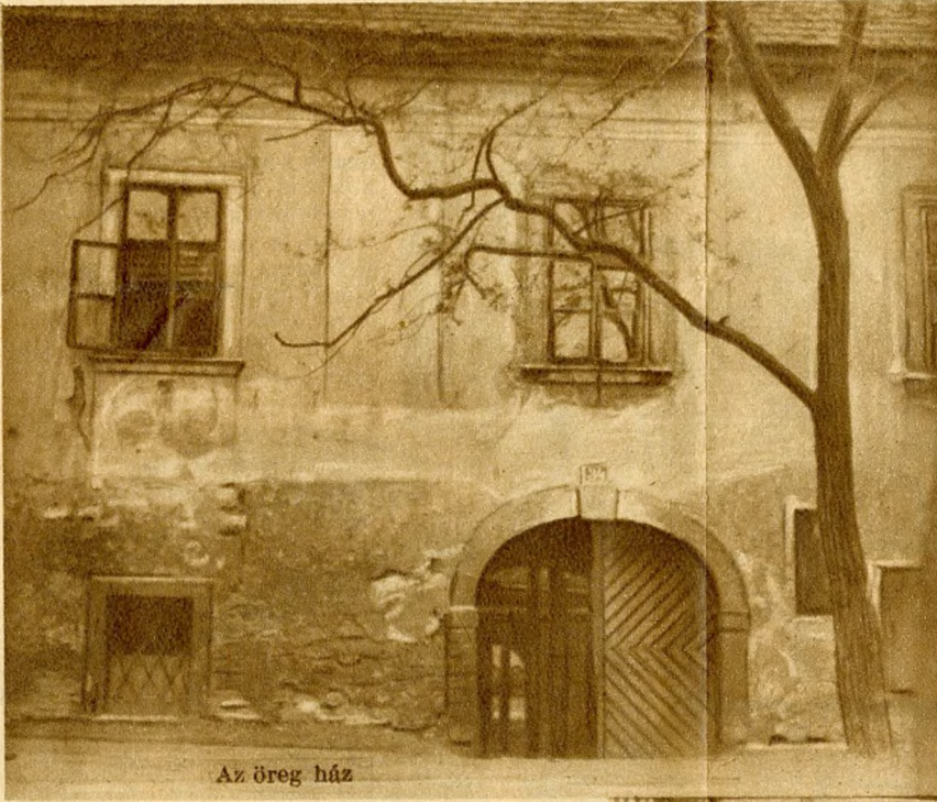
Az öreg ház

A vizivárosi bucsu előtt egy héttel történt, úgy emlékszem, mint ma, egyszer csak emberek jöttek nagy rudakkal és megtámasztották a házat, hogy össze ne dőljön. Azóta is így van világ csufjára! — meséli egy öreg asszony, aki a földszinten lakik, özvegy, albérlőket tart és abból tengeti életét.