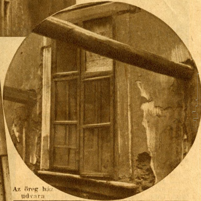
Az öreg ház udvara

repedezett falak előtt és a támaszgerendák alatt, a régi hangulatot terjesztő szűk kis udvaron ez a nimbusz még él.