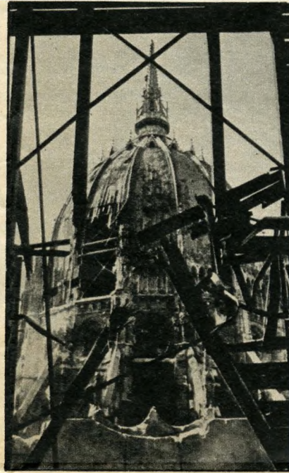
Az Országház 1945-ben