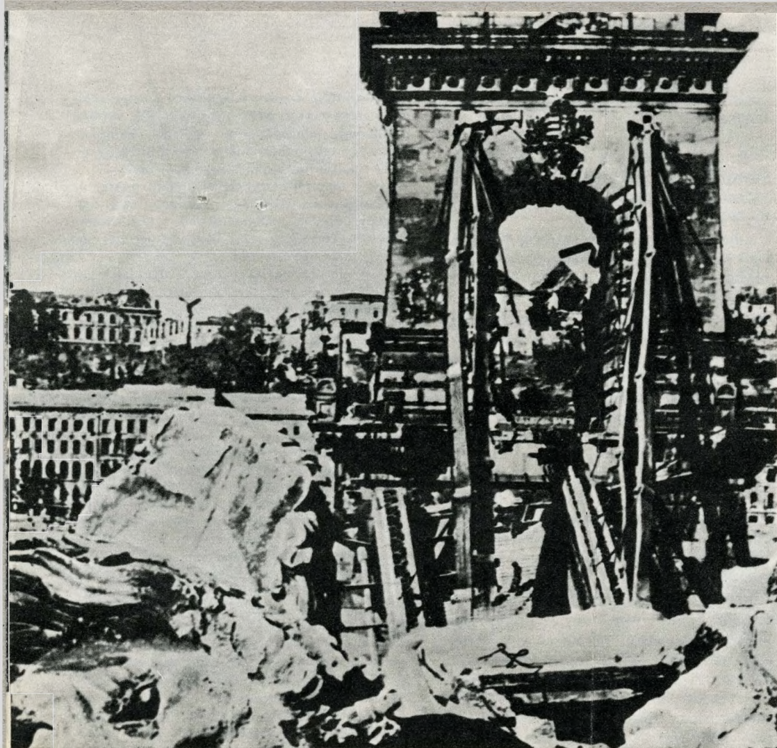
A felrobbantott Lánchíd és a lerombolt budai Várnegyed