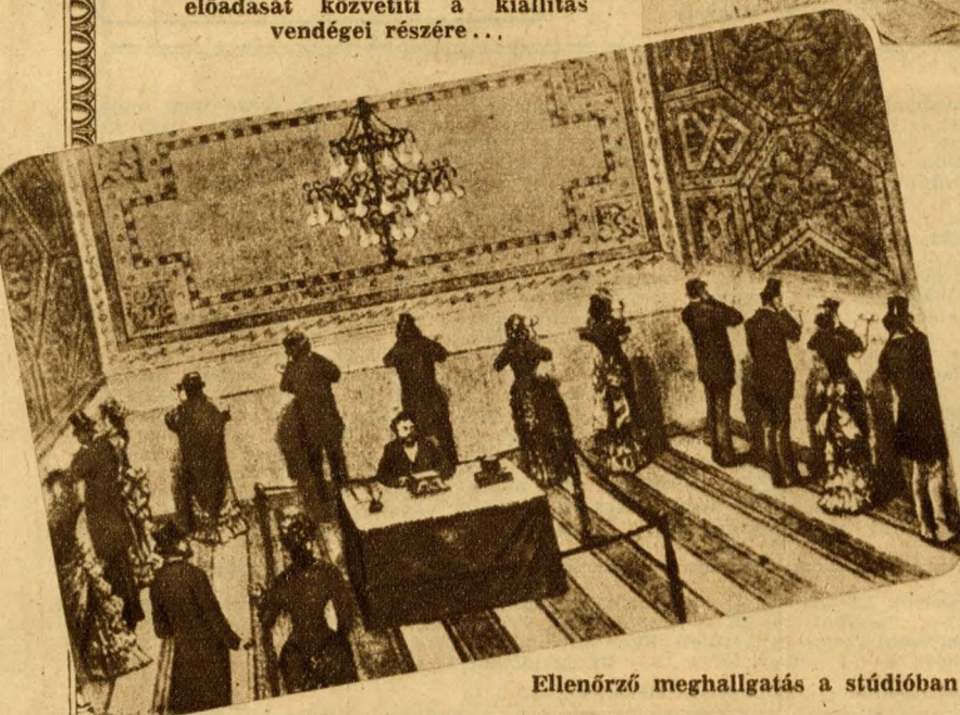
Ellenőrző meghallgatás a stúdióban