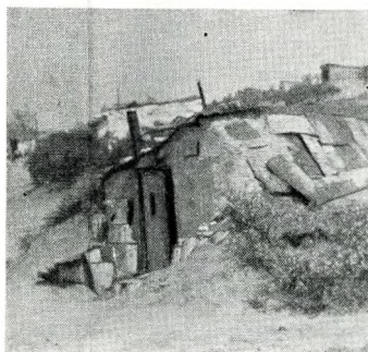
A pesterzsébeti Hanga-telep

hatjuk, hogy ebben a működő 3 Karitász-irova 1 480 888 pengőt teremtett elő segélyezésre, 600 467 ebédadagot osztott szét, 250 154 kg kenyeret, 177 152 liter tejet, 459 839 kg egyéb élelmiszert, 7385 cipőt és 354 809 pengő pénzbeli segélyt stb.