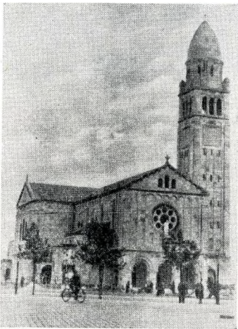
A középső-ferencvárosi plébániatemplom a Haller téren — egy kisszakasznyira a nyomorgyedektól

szavaztak meg fejenként több ezer pengőt. A katolikus egyháznak nyújtott segítség e felsorolásban nem szerepel.