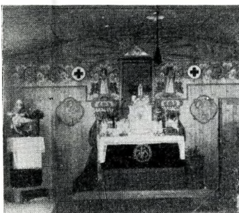
A Mária Valériatelepi barakk-kórház kápolnája

Az egyházak telepi térítő tevékenységének főleg ott teremnek gyümölcssei, ahol sokgyermekes, évek óta munkanélküli, betegségekkel és egyéb csapásoktól sújtott emberek élnek, akikből a halmozódó bajok irreális szemléletet, csodavárást váltottak ki és így fogékonyakká váltak a „kegyelem szentsége” iránt.