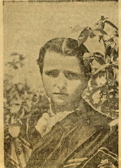
Une magyare en fleurs...

Pendant l'entr'acte, consacré au rêve dans la fumée des pipes et