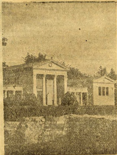
L'ancienne ville romaine Aquincum près de Buda

de tôle », auxquelles on accède par un escalier de bois gémissant. On loue ces chambres à la semaine ou à la journée et la concierge n'accepte comme locataires, que les personnes « comme il faut », c'est-à-dire ni les journaliers ni les ouvriers : seulement les « ratés », les zéros.