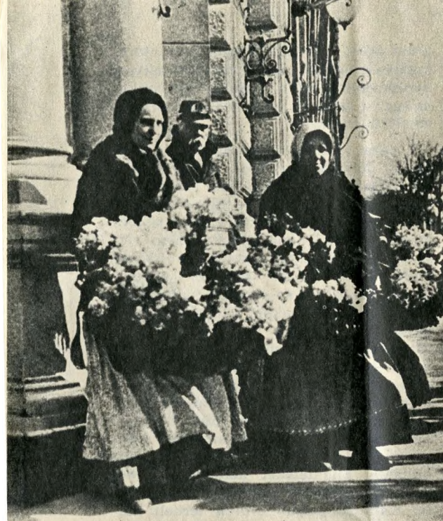
Virágáros asszonyok és hordár a századfordulón