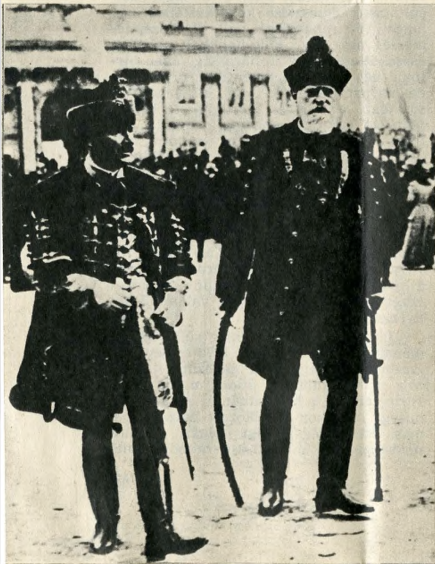
Magyar arisztokraták ünnepi díszben