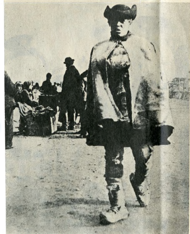
Szlovák munkás a pesti piacon

amelynek során a szociális konfliktusok vallási vagy etnikai mezben jelentkeztek, és új tápot, sőt új gazdasági alapot adtak a hagyományos antiszemitizmusnak.