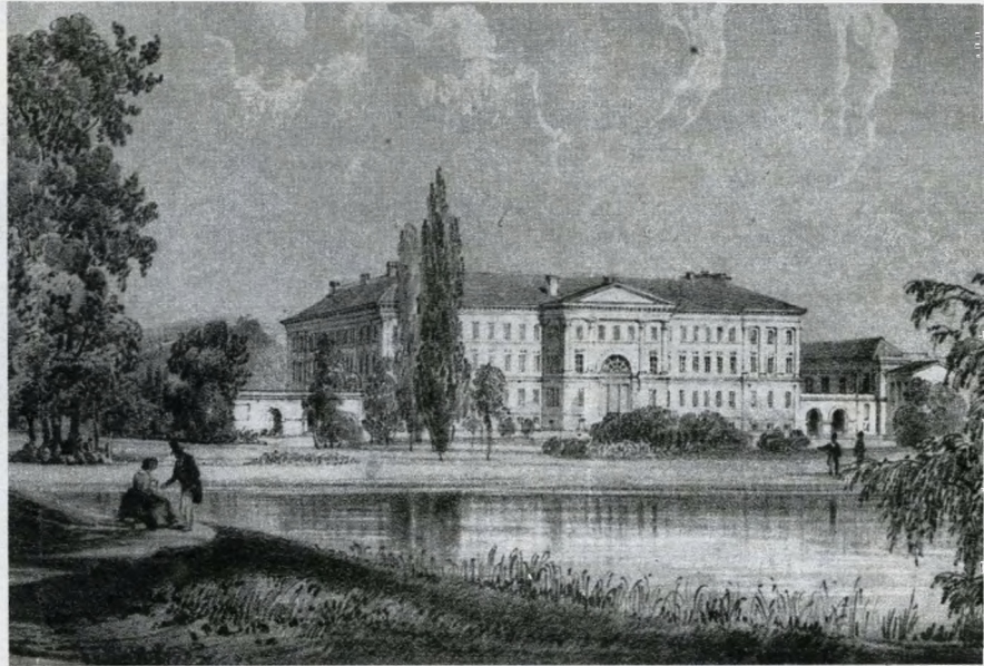
A Ludovika épülete 1845-ben. R. Alt kőrajza

1898-ban új kiképzési rendet vezettek be nyolc középiskolát (érettségi nem volt kötelező) vagy honvéd főreáliskolát végzettségük számára. Három év volt a tanulmányi idő. Az akadémia szervezési és tanügyi felépítése azonos volt a Wiener Neustadt-i k.u.k. akadémiával. A végzett hallgatók hadnagyként kerültek a honvédséghez. Az első, valóban teljes értékű tanulmányokat folytatott tisz-