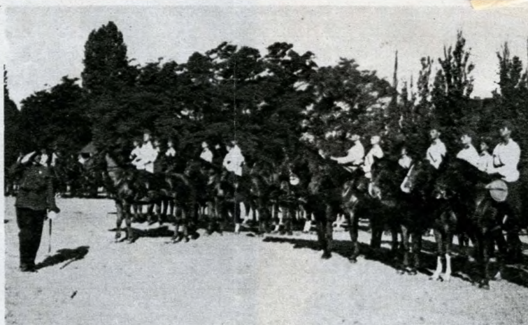
Indulás a nyári gyakorlatra

A korszak ellenforradalmi volt, annak minden ismert velejárójával. A ludovikások ebben a légkörben éltek mint a rendszer kiválasztottjai. Az ellenforradalom alappillére: a revizionizmus és az antibolsevizmus volt. A Ludovikán is ehhez igazodtak. A leendő tiszték gondolkodásába szinte belepréselték a revízió szükségességét, és ez az agitáció mely nyomot hagyott a kor szellemétől magukat függetleníteni nem tudó