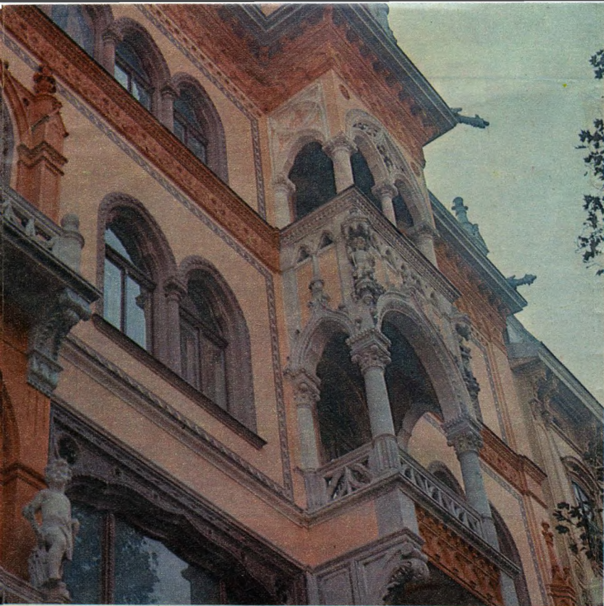
A 7. számú, gazdagon díszített ház a főváros egyik legszebb épülete