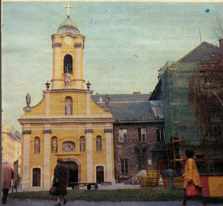
Új korában sem volt ilyen szép ez a ház!